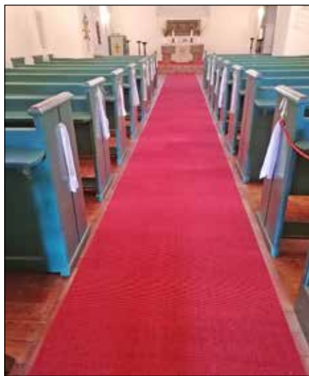
Roter Sisal ersetzt den alten Läufer.