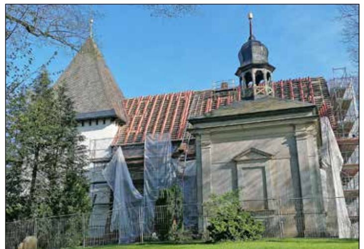
Eingerüstet: Aktuell wird das Dach der Marienkirche neu gedeckt.

allen historischen Gemäuern ist nach der Sanierung vor der Sanierung. Mut macht der Blick nach oben: Derzeit wird das Dach des Kirchenschiffes neu gedeckt, die Toilettenanlage steht auf der Vorhabenliste und hinter der Erneuerung der Friedhofsbank, von der aus der Blick ins Weite schweift, steht schon ein Häkchen für „erle-