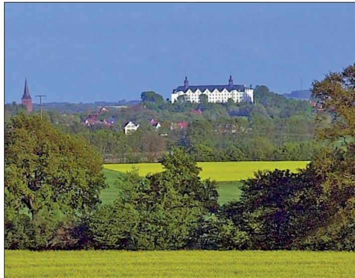
Ein besonderer Trauort mit historischem Ambiente: das Plöner Schloss.

Auch in der Preetzer Stadtkirche atmen Hochzeitspaare Geschichte: die ältesten Bauteile im Chor des Gotteshauses St. Lotharii gehen auf die Zeit um 1200 zurück. Doch größtenteils