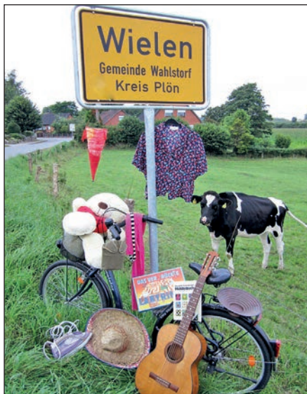
Wielen bereitet sich auf den „Flohmarkt vor der Haustür“ vor.

Wielen (t). „Schnäppchen, schlendern und schlemmen“ – unter diesem Motto findet am Sonntag, 2. Juni, von 9 bis 16 Uhr in der Gemeinde Wahlstorf wieder der beliebte Dorfflohmarkt „Flohmarkt vor der Haustür“ statt. Die Einwohner*innen des idyllisch am Wielener See gelegenen Dorfes räumen dann ihre Dachböden, Keller und Schuppen, um ihre ausrangierten Waren direkt vor der Haustür zu präsentieren. Von Haushaltswaren, Bekleidung, Kinderspielzeug und Nützlichem bis hin zu Antikem und Kuriosum ist sicher für jeden etwas dabei. Da beim Dorfflohmarkt auch viele Menschen ihre Stände aufbauen, die sonst nie auf Flohmärkten verkaufen, können auch „Schatzsuchende“ hier vielleicht ein tolles Schnäppchen machen. Die Wie-