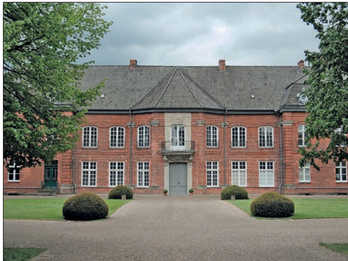
Beliebter Trauort: das Plöner Prinzenhaus.