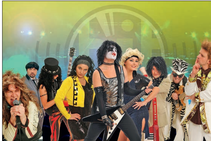
Die „Hit Radio Show“ kennt man von der NDR-Sommertour.

Für die Organisation hat sich der Veranstalter, der Stadtmarketingverein „Schusterstadt Preetz e.V.“, mit den Agenturen „Gallinat Events“ und „Bühne 39“ professionelle Hilfe ins Boot geholt.