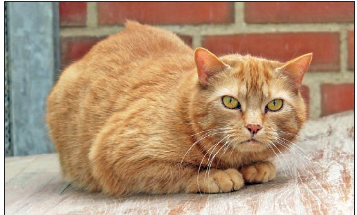
... als auch Zora bewegen sich gerne in der Natur.

An der B430 · 24306 Kossau/Lebrade · Tel. 04522 / 2389