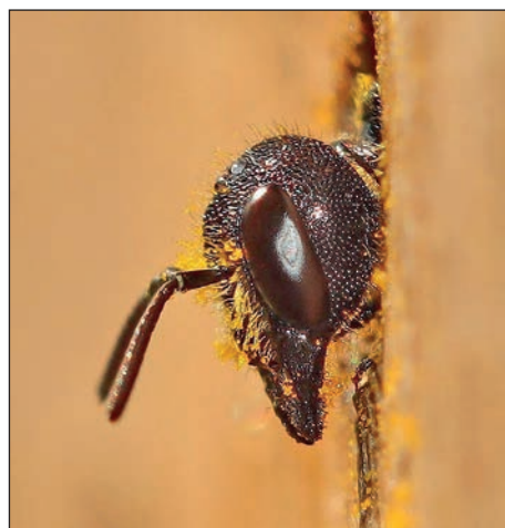
Dieses Bild zeigt eine Löcherbiene. Sie besiedelt vor allem Waldränder und Waldlichtungen, Streuobstwiesen, Hecken, alte Weingärten und Gehölze.

Eutin (t). Warum sind Wildbienen so wichtig? Haben die im Sommer oft störenden Wespen ihren schlechten Ruf eigentlich verdient? Gibt es vegetarische Wespen und sogar fleischfressende Bienen? Und was haben eigentlich die Ameisen mit alledem zu tun? Diese und weitere Fragen werden bei einer Exkursion mit dem Naturpark-Ranger entlang der Eutiner Stadtbucht am Sonntag, 26. Mai, von 10.30 bis 12.30 Uhr beantwortet. An den verschiedenen Stationen dreht sich alles um die Vielfalt der heimischen Wespen und Bienen und die spannenden Zusammenhänge und Beziehungen in der Insektenwelt. Ein Fernglas sollte mitgebracht werden. Der Teilnahmebeitrag