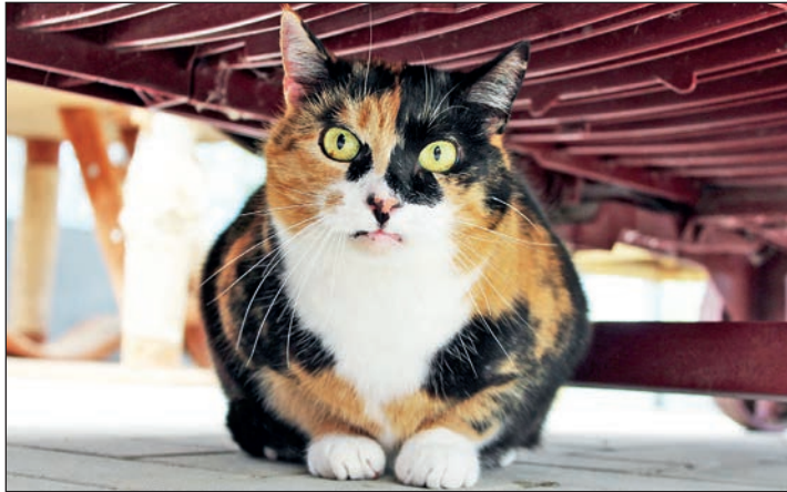
Die beiden Katzen-Schwestern sind etwas scheu, aber sowohl Zelda ...

Zora ist lustig dreifarbig gemustert. Die schönen Miezen leben schon seit eineinhalb Jahren im Tierheim. Bisher hatten sie noch kein Vermittlungsglück, weil