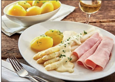
Schlemmen und genießen können die Gäste beim großen Spargel-Buffer im beliebten Landhaus-Restaurant.

mit fachkundiger Reiseleitung und Besichtigungen erwartet werden. Anschließend sind die Reporter-Leser*innen für zwei Stunden zu Gast auf dem Vierländer Erdbeerfest rund um das idyllische Freilicht-Museum am Rieck-Haus, wo traditionelle Trachtentänze, ganz viel fröhliche Musik und viele regionale Schlemmerprodukte frisch aus den Marschlanden für die Besucher auf den Tisch kommen. Vor der Kulisse des Rieck-Hauses und den malerischen Bauerngärten präsentieren sich zudem Trachtengruppen aus den Vier- und Marschlanden, zünftige Plattsnacker und viele historische Handwerkskünste können bestaunt werden.