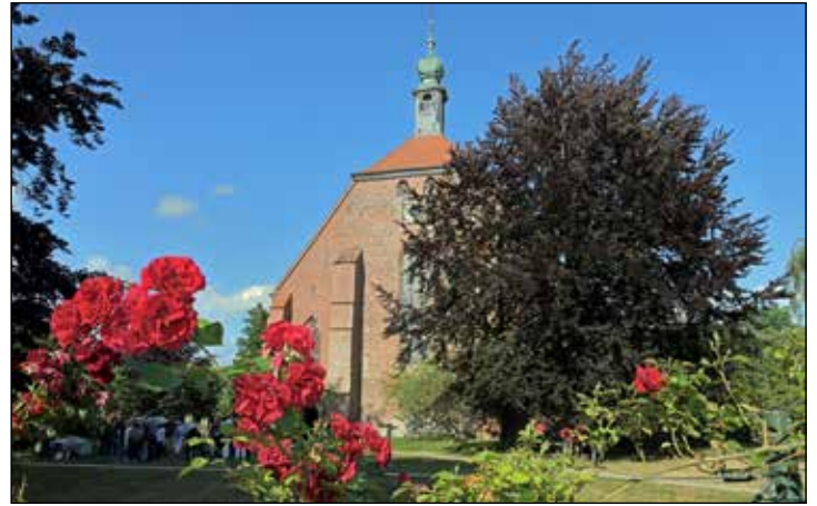
Bis Mitte Oktober finden regelmäßig Führungen in der Klosterkirche statt.

Anfrage gibt es außerdem die Möglichkeit, eine Gruppenführung zu buchen – dann auch zu den Themenschwerpunkten Tafelbilder, historische Orgel oder Predigerbibliothek. Der Eintritt pro Person kostet 5 Euro, für Kinder unter 14 Jahren und Grundschulklassen ist er frei.