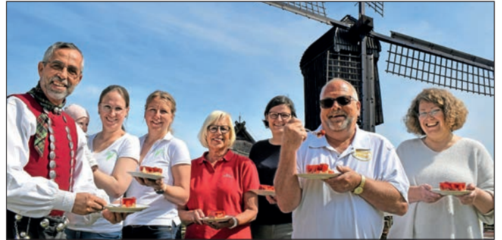
„Das Gold der Vierlande“ genießen die Leser*innen auf dem großen Erdbeerfest im berühmten Freilichtmuseum an der Elbe.

Auf dem Rückweg werden unsere Leser*innen sodann zum frühen Abendessen im beliebten Landhaus-Restaurant mit einem großen Spargel-Buffer mit vielen Beilagen und süßen Dessert-Variationen rundum verwöhnt. Das Komplett-Paket der großen Schlemmer-Tour zum Sonderpreis von nur 59,90 Euro umfasst die Busfahrt im erstklassigen Fernreisebus ab Plön