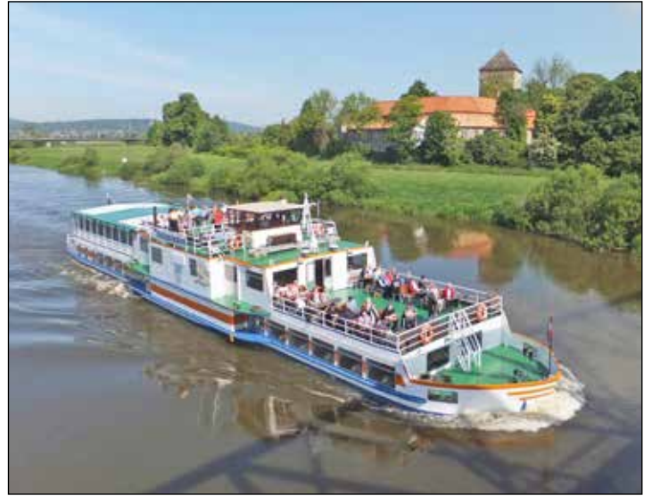
Mit dem Weser-Dampfer geht es ab Bremen mit großem Grill-Bufferet an Bord Kurs Lüneburger Heide.

Anmeldungen für diese besondere Blütenfahrt sind ab sofort bei