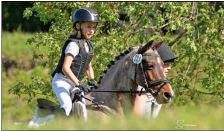
Auf dem Hof Bredeneek wird wieder geritten.

Bredeneek (t). Die Vorbereitungen laufen auf Hochtouren. Der Reiterverein Preetz richtet am Sonnabend und Sonntag, 1. und 2. Juni, erneut die Kreismeisterschaft des Kreisreiterbundes Plön der Vielseitigkeitsreiter aus. Am Sonnabend werden Reiterinnen und Reiter der Klasse A, am Sonntag in der Klasse E auf dem Gelände der Familie von Paepcke auf dem Hof Bredeneek erwartet, um die neuen Kreismeister der Vielseitigkeit zu küren. An beiden Tagen wird am Vormittag mit Dressur und Springen begonnen, bevor es am Nachmittag zum Highlight übergeht: Eine E und ein A**-Geländestrecke durch den wunderschönen Bre-