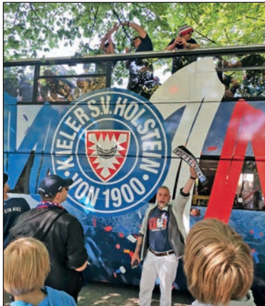
.....und begeisterte KSV-Anhänger

Gewiss mit den erwähnten drei Teams wird man nicht mithalten können, aber das Ziel der Störche sollte sein, sich auf der Höhe von Mannschaften wie Mitaufsteiger St. Pauli, Heidenheim, Mainz 05 oder bei Redaktionsschluss noch nicht entschieden-dem VfL Bochum oder Fortuna Düsseldorf einzureihen. Inwieweit der Kader noch verstärkt wird, bleibt abzuwarten. Ein Ersatz für Phi-