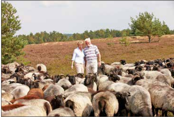
Zum Höhepunkt der blühenden Heide entdecken die Leser*innen die malerischen Landschaften in den schönsten Farben.

den Reporter-Leser-Reisen des Burg-Verlages in Eutin, täglich von 9 bis 13 Uhr unter Telefon 04521-701130 oder direkt online auf leserreisen@der-reporter.info möglich.