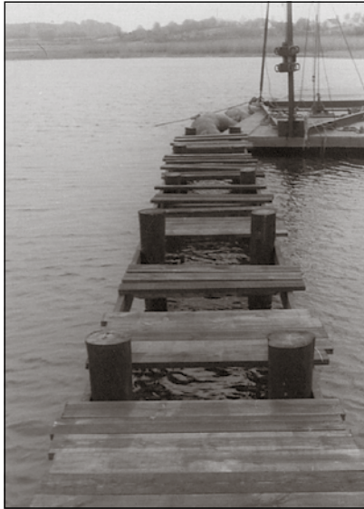
Vor 60 Jahren entstand mit dem Verein auch die eigene Hafenanlage.

sind vertreten. Über Nachwuchs freut sich der Verein immer. Sieben- bis 14-Jährige trainieren donnerstags mit dem Opti, Jugendliche und Erwachsene am Mittwoch. Die nächste Regatta im Preetzer Segelrevier findet am 8. und 9. Juni statt. Nähere Infos erhalten Interessenten online auf www.segelclub-preetz.de oder bei Jugendwart Benjamin Kühn, Telefon 0171-2446836.