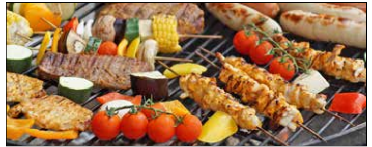
Ein reichhaltiges und leckeres Sommer-Grill-Bufferet erwartet die Teilnehmer*innen an Bord.