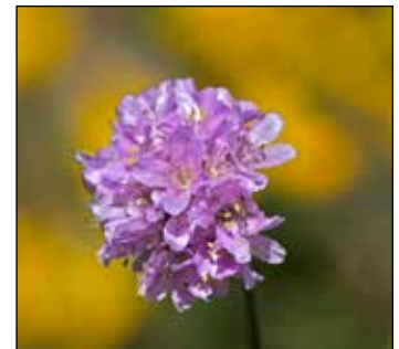
Die Grasnelke ist die Pflanze des Jahres 2024.

Neben Informationen zur Entstehung und Entwicklung des Gebietes gibt es aber auch Interessantes über Pflanzen und Kräuter am