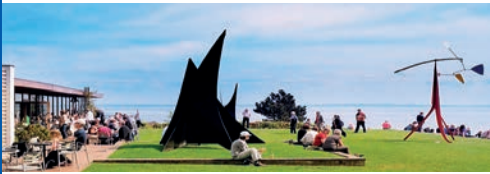
Kunst-Museum „Louisiana“ in einmaliger Lage am Öresund