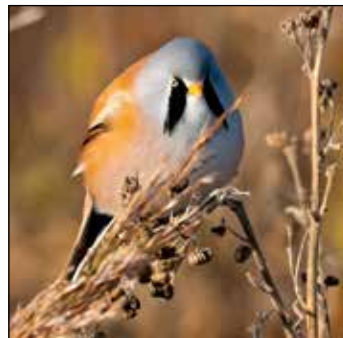
Das Männchen der Bartmeise trägt einen auffälligen „Bart“.

Sehlendorf (t). Die Schutzgebietsbetreuer des NABU laden zu einer Exkursion am Freitag, 31. Mai am Sehlendorfer Binnensee ein. Die eintrittsfreie Veranstaltung, die sich auch für Familien mit Kindern gut eignet, findet im Rahmen des landesweiten Aktionsmonats Naturerlebnis statt und beginnt um 16 Uhr an der Tourist-Information (54°18'23"N - 10°41'22"O) in Sehlendorf Strand, Strandstraße 24. Die Tour dauert rund zweieinhalb Stunden. Der Sehlendorfer Binnensee gehört zu den interessantesten Naturschutzgebieten an der Ostsee. Der Flachwassersee mit seinen Salzwiesen, dem Brackwasserröhricht und Sandbänken lockt zahlreiche Vögel von der Bartmeise bis zum Seeadler an. Neben der spannenden Vogelwelt hat auch die Botanik viel zu bieten. Nicht nur die Grasnelke, Pflanze des