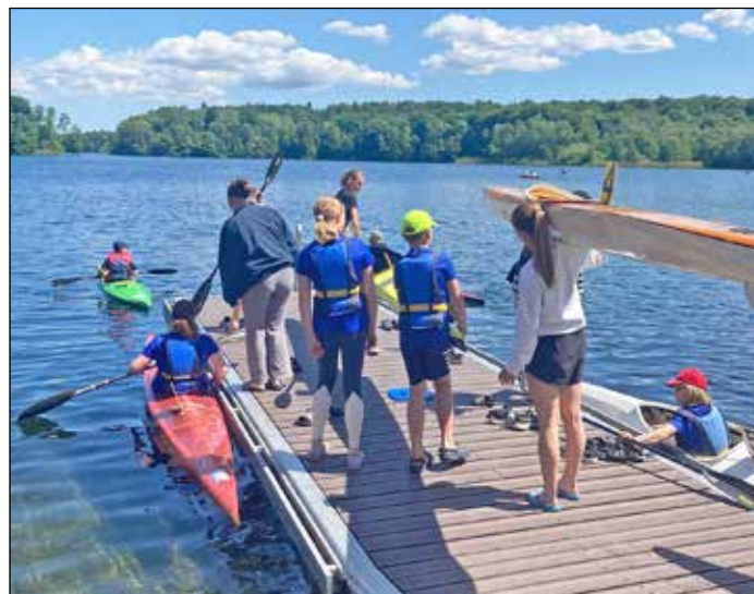
Reges Treiben auf dem Höftsee.

Plön (t). Am 1. und 2. Juni veranstaltet der Wassersportverein Plön Fegetasche (WPF) seine 35. Kanu Rennsportregatta auf dem Höftsee. Über 90 Aktive aus 14 Vereinen haben sich angemeldet. Am Sonnabend werden ab 13.30 Uhr die Sprintrennen über 100 und 200 m in verschiedenen Altersklassen (7 bis 70 Jahre) gestartet. Am Sonntag geht es dann ab 9.15 Uhr auf die Langstrecke (1.500 und 6.500 m). Die Strecke führt zweimal durch den Kanal zwischen Höft- und Edebergsee und verspricht in dieser Engstelle spannende Kämpfe Bord an Bord. Alle Wettkämpfe können sowohl vom Wanderweg am Höftsee als auch vom Grundstück des WPF an der Ölmühle oder vom Grundstück des Lakehouses beobachtet werden. Auch nichtorganisierte Wassersportler können beim Rahmenrennen im Standupboard