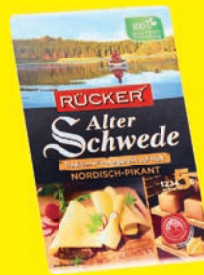
Rücker Käsescheiben verschiedene Sorten 45–60% Fett i. Tr. 100 g (1 kg = 12,50 €)