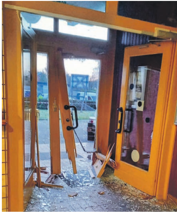
Das Fahrzeug krachte gleich zweimal in die Eingangstür, die daraufhin geborsten ist.

Und die ursprünglich für den 10. Dezember geplante Wiedereröffnung der Schwimmhalle wird sich auf Anfang oder Mitte Januar verzögern“, erläutert der Verwaltungschef. Der verursachte Gesamtschaden dürfte laut Einschätzung der Polizei im unteren fünfstelligen Bereich liegen. Ein Handwerksbetrieb hat noch am Donnerstag eine provisorische Eingangstür montiert. Dass der Polizei der genaue Tatablauf bekannt ist, verdankt sie einem Mitarbeiter einer Baufirma, der als einziger an diesem Morgen bereits vor Ort war und sich selbst angesichts der überfallartigen Situation in den Keller rettete. Der Zeuge konnte aber noch beobachten, wie nach dem Unfall zwei