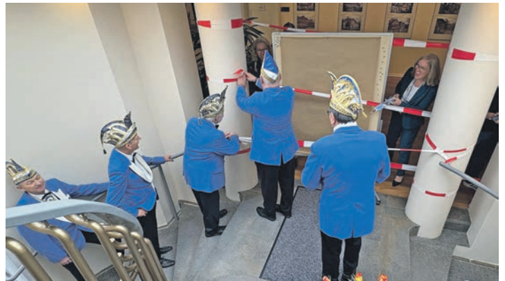
Beim Rathaussturm musste sich der Elferrat durch die Flutterband-Absperrung kämpfen.

Das Jubiläum wollen die Karnevalisten am 16. und 17. Januar mit gleich zwei Festen im Gasthaus Schlüter in Wankendorf