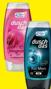
duschdas Duschgel verschiedene Sorten 225 ml (1 Liter = 3,70 €)