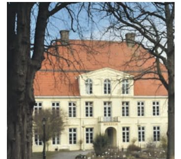
Das Plöner Kreismuseum als eines der ältesten Bauwerke der Stadt, Ort der Geschichte und Geschichten, bildet das Motiv für den Adventskalender des Vereins Stadtmarketing.

sische Einerlei heraus und verspricht Spaß und Spannung bis Weihnachten ist. Erhältlich sind die Kalender bei Optiker Bode, Hygge 13, Fielmann, in der Hof Apotheke, bei Carstens Optic, in der VR Bank und der Förde Sparkasse, der Tourist Info im Bahnhof sowie bei REWE David Schnibben, im Töpferhaus und im Café Wohlsein am Strohhberg.