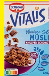
Dr. Oetker Vitalis-Müsli verschiedene Sorten 390–600 g (1 kg = 4,17–6,41 €)