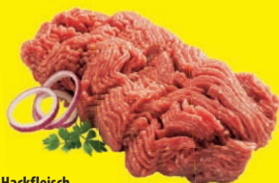
Hackfleisch vom Schwein zum Braten und Garen vielseitig zu verwenden oder gemischtes Hackfleisch 1 kg = 9,99 €