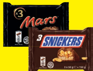
Snickers, Twix 150 g oder Mars 135 g 3er-Riegel (1 kg = 8,33/9,26 €)