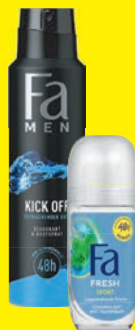
Fa Deospray oder Roller verschiedene Sorten 150/50 ml (1 Liter = 8,33/25,00 €)