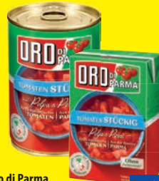
Oro di Parma Tomaten verschiedene Sorten 400 g (1 kg = 3,13 €)