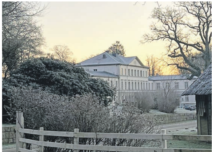
Für den Ausstellungsbesuch am 22. und 23. November ist der Schlosskeller des Herrenhauses von Gut Nehnten geöffnet.

Die „Kleine Galerie“ der Malerin Katja Meier-Chromik befindet sich vor Ort am Großen Plöner See. Monatlich wechseln ihre Ausstellungen.