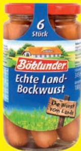
Böklunder Echte Land- Bockwurst 6 Stück in Eigenhaut 180 g (1 kg = 9,26 €)