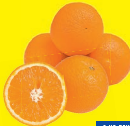
Spanien Orangen „Navelinas“ KL 1 (1 kg = 1,67 €)