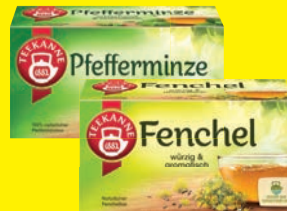
Teekanne Naturkräuter- oder Früchtetee verschiedene Sorten 18–20er