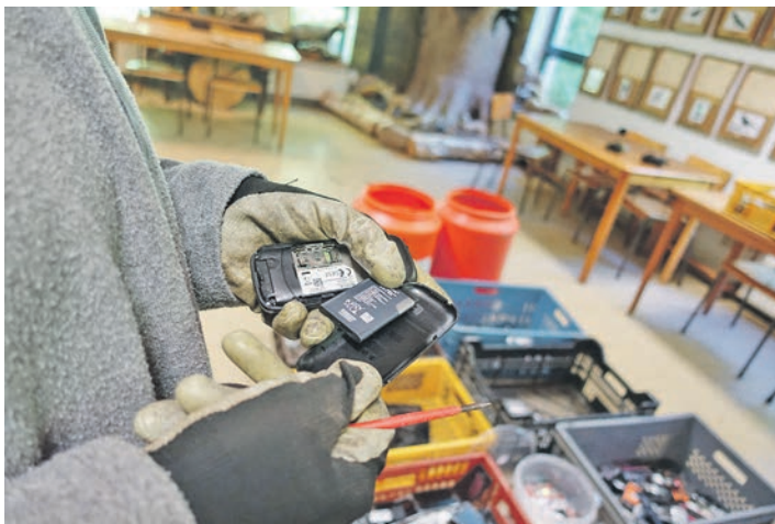
Beim nächsten Reparaturcafé informiert der BUND über die Sammlung von gebrauchten Handys.