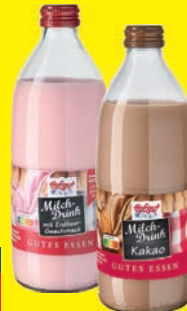
Hofgut Milch-Drink verschiedene Sorten 1,5% Fett 500 ml (1 Liter = 1,67 €)