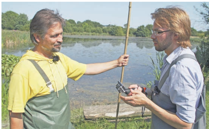
„Der Eimersee“ ist ein Dokumentarfilm aus dem Jahr 2015 von Sven Bohde, der die kuriose Entstehungsgeschichte eines Sees in Eckernförde erzählt.

letzten Jahr für 2025 zugesagt, nachdem mehrere Gäste ihn als Wunschfilm favorisiert haben. Außerdem wird es auch wieder das von Oppermann moderierte Film-Quiz geben, bei dem es zum Spaß der Gäste prickelnde Ahoi-Brausetütchen zu gewinnen gibt, die ebenfalls so wunderbar auf der Zunge prickeln. Der Eintritt kostet 15 Euro inklusive Häppchen. Um eine Anmeldung per E-Mail an kontakt@seeweg-gutwittmoldt.de oder unter Telefon 0151-46564999 wird gebeten. Weitere Infos online auf www.seeweg-gutwittmoldt.de .