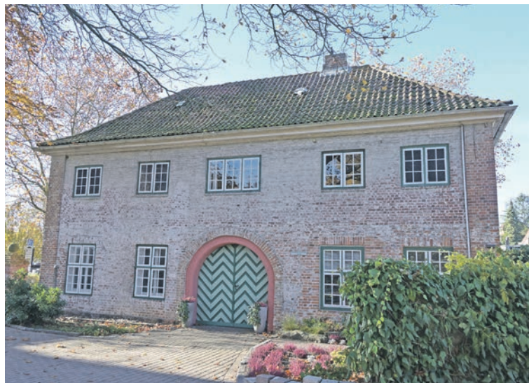
Ein Ort mit Geschichte: Die Friedhofskapelle an der Eutiner Straße in Plön wurde Anfang des 19. Jahrhunderts aus den Backsteinen der alten Friedhofsmauer errichtet, die bis dahin den Kirchhof rund um die Nikolaikirche umfriedet hatte – der Plöner Marktplatz befindet sich auf einem jahrhundertealten Begräbnisfeld.