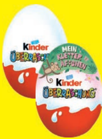
Kinder Überraschung 20 g (1 kg = 41,67 €)