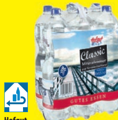
Hofgut Mineralwasser verschiedene Sorten 6 PET-Flaschen à 1,5 Liter (1 Liter = 0,28 €) zzgl. 3,00 € Pfand