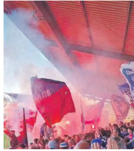
Stimmung ist am Betzenberg garantiert.

res verlegt. Gestern hatte der TSV Plön den TSV aus Gremersdorf in einem Nachholspiel zu Gast. Die Länderspielpause ist beendet und damit startet auch die 2. Bundesliga wieder. Die KSV Holstein muss am Sonntag, 23. November um