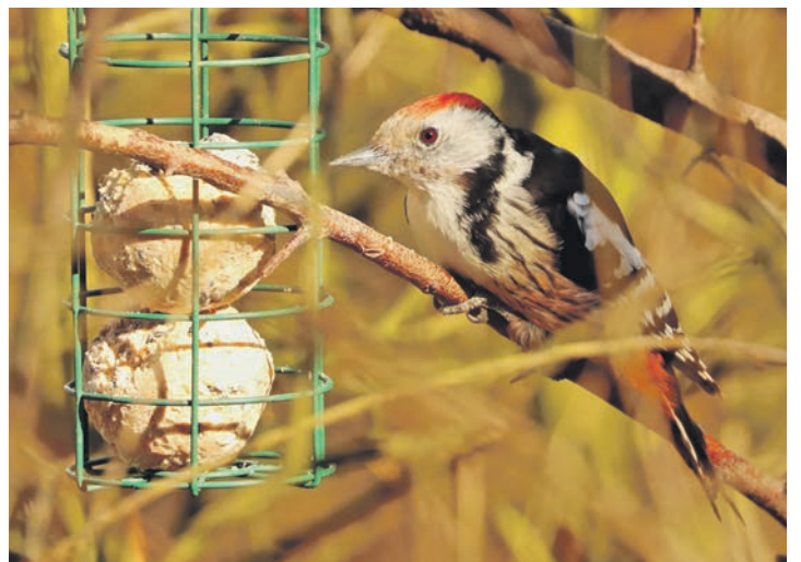
Mittelspecht am Futterplatz nahe der Pohnsdorfer Stauung bei Preetz. Er trägt eine rote Haube und ist schmaler und etwas kleiner als der Große Buntspecht, von dem er sich beim Vergleich deutlich unterscheidet.

rand, Park, Stadtgewässer, Dorf und Einzelhaus) und ob dort zum Beispiel eine Vogelfütterung stattfindet. Es ist ein wertvoller Beitrag für den Natur- und Umweltschutz. 2025 haben sich weniger Vögel als 2023 bei der „Stunde der Wintervögel“ blicken lassen. Deutschlandweit haben sich 122.000 Menschen an der Aktion beteiligt. Deutlich weniger Amseln wurden gesichtet, ein Minus von 18 Prozent. Auch Haussperling und Feldsperling