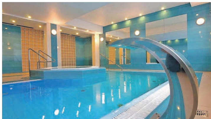
Herrliche Entspannung bietet das schöne Hallenbad im Hotel.

Öffnungszeiten: Mo.-Fr. 9-18 Uhr • Sa. 9-13 Uhr www.zweirad-scheibel.de