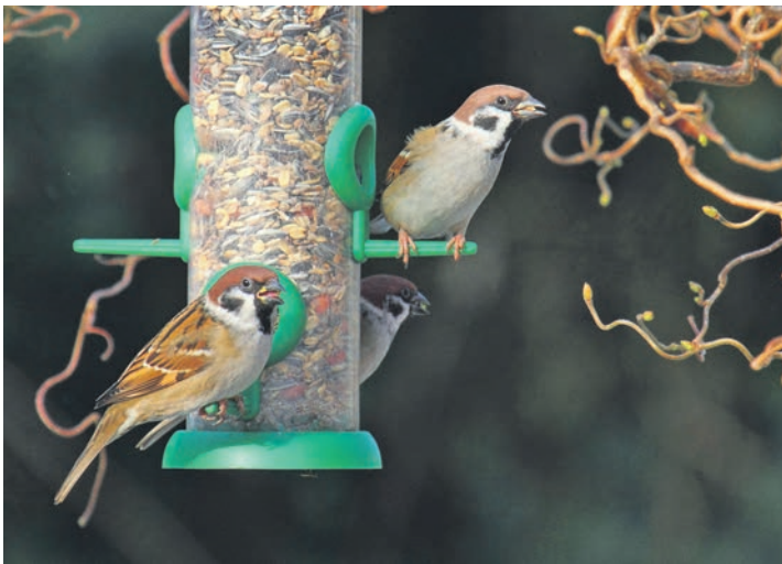
Am Futersilo tummeln sich Feldsperlinge. Sie können mit Haussperlingen leicht verwechselt werden.

Kreis Plön/Ostholstein (t). Im Januar 2026 geht bundesweit die „Stunde der Wintervögel“ in die 16. Runde. Dafür ruft der NABU alle Naturfreund*innen auf, wieder eine Stunde lang die Vögel am Futterhäuschen, im Garten, auf dem Balkon oder im Park zu zählen und dem NABU zu melden. Die Zählung findet vom 9. bis 11. Januar 2026 statt. „Selbst wenn man noch nie Vögel gezählt hat: Es ist wirklich nicht schwer und macht großen Spaß“, meint der Plöner NABU Umweltberater Carsten Pusch: „Einfach ein gemütliches Plätzchen am Fenster, im Garten, auf dem Balkon oder im Park suchen und dort eine Stunde lang beobachten, was dort herumfliegt.“ Ein Fernglas ist dabei sicher nützlich, aber nicht unbedingt