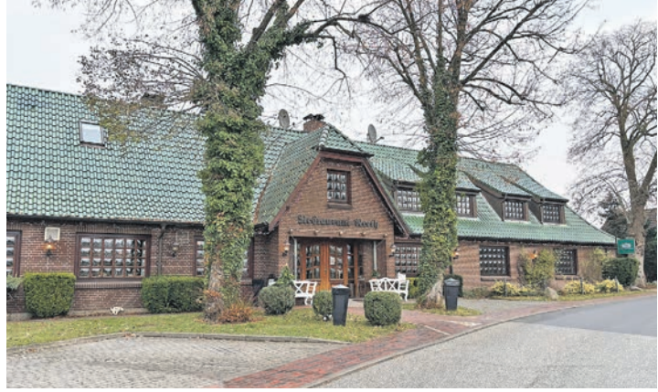
Von Preetz aus fährt man direkt auf das von Linden gesäumte Restaurant „Linde by Neeth“ in Dammdorf zu.

Die Küche ist Montag bis Freitag von 17.30 bis 21 Uhr, Sonnabend von 12 bis 14.30 und 17.30 bis 21 Uhr sowie Sonntag von 12 bis 14.30 Uhr geöffnet. Weitere Informationen zu Restaurant und Hotel sind unter Telefon 04342-82374 oder online auf www.neeth.de erhältlich.