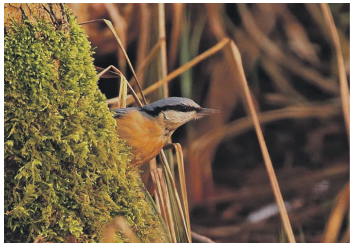
Der hübsche Kleiber – hier ein Vogel im Plöner Ölmühlengebiet - ist auch als Spechtmeise bekannt und liebt Erdnussbruch.

Eine weitere Möglichkeit: Wer ein entsprechendes NABU-Faltblatt hat, überträgt seine Beobachtungen auf den dort enthaltenen Mitmach-Coupon, frankiert ihn ausreichend und sendet ihn