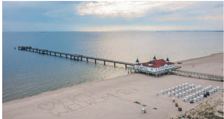
Deutschlands sonnenreichste Ostseeinsel erwartet die Leser zum Top-Termin des Jahres im März 2026.

unter der Organisationsleitung von Schauspieler Til Demtröder, der bereits zum zehnten Mal die „Baltic Lights“ zur großen Begeisterung der Besucher zum Jubiläum mit vielen spektakulären Aktionen organisiert. Am vierten Tag erfolgt eine Mittagspause in Warnemünde. Die Kurtaxe ist direkt vor Ort im Hotel zu zahlen. Anmeldungen zu dieser einmaligen Sonderreise sind ab sofort bei den Leser-Reisen des Burg-Verlages in Eutin, täglich von 9 bis 13 Uhr, unter Telefon 04521-701130 oder direkt online im Internet auf leserreisen.der-reporter.info möglich.