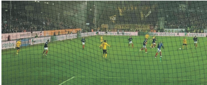
Wie immer mit starkem Support: Die Dynamo-Fans.

SC Paderborn am 18. Januar (13.30 Uhr). Nur fünf Tage später, am 23. Januar (18.30 Uhr), geht es auf die Alm zur Bielefelder Arminia. Gegen dieses Auftaktduo gab es in den Hinspielen zwei Niederlagen. Nun geht es erstmal nach Silvester ins Trainingslager gen Spanien. Dort wird man vom 4. bis 11. Januar in Algorfa Zeit haben, die doch durchwachsenen Leistungen aufzuarbeiten. Der Fokus wird auch auf Neuzugängen liegen, die dem Verein - hier besonders in der Offensive - sofort helfen können