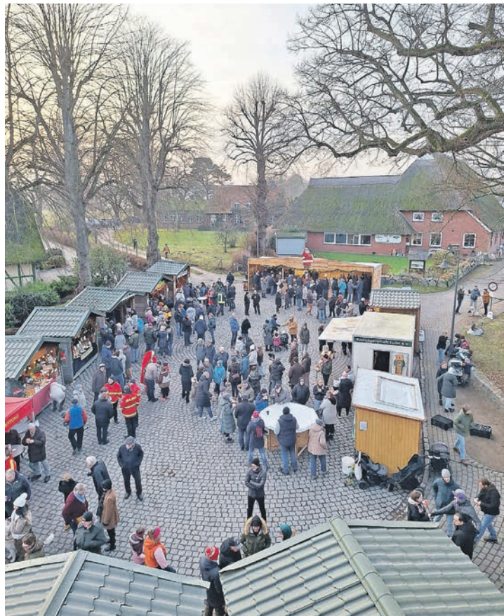
Stimmungsvoll: der Bosauer Weihnachtsmarkt.

Die Feuerwehr der Gemeinde sorgte für die Sicherheit und ließ das ein oder andere Kind ihr Fahrzeug erkunden – dieses stand in diesem Jahr quer über die Straße- sicher ist sicher. Auf dem Heimweg nahmen sich viele Leute noch einen passenden Weihnachtsbaum mit.