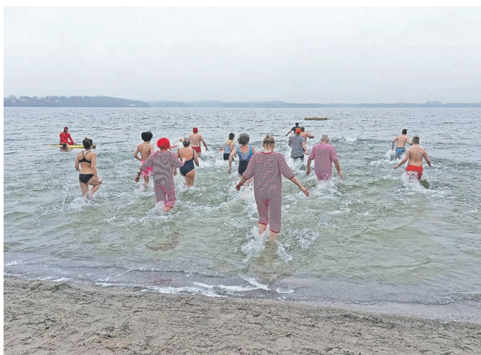
Das eisige Bad hat Tradition in Bosau – hier eine Aufnahme aus 2023.

Die Bosauer Wasserretter blicken auf ein gutes wie auch ereignisreiches Jahr 2025 zurück. Die anerkannte Wasserrettungseinheit hatte mehrere größere Einsätze über den Sommer – auch wenn das Wetter und damit verbunden die Wachst