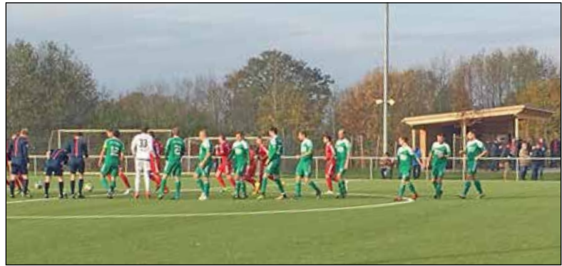
Spielszene beim Spitzenspiel gegen den Gettorfer SC.

einer der besten Vorlagengeber(5) aus der Landesliga Schles-