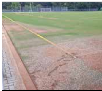
Durch die Witterung beanspruchter Kunstrasenplatz Klausdorf.