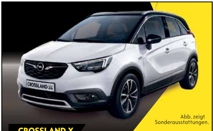
Abb. zeigt Sonderausstattungen.

Suche Auto mit oder ohne Tüv. Tel. 0173 6319413 Suche Motorrad oder Quad. Tel. 0173 6319413