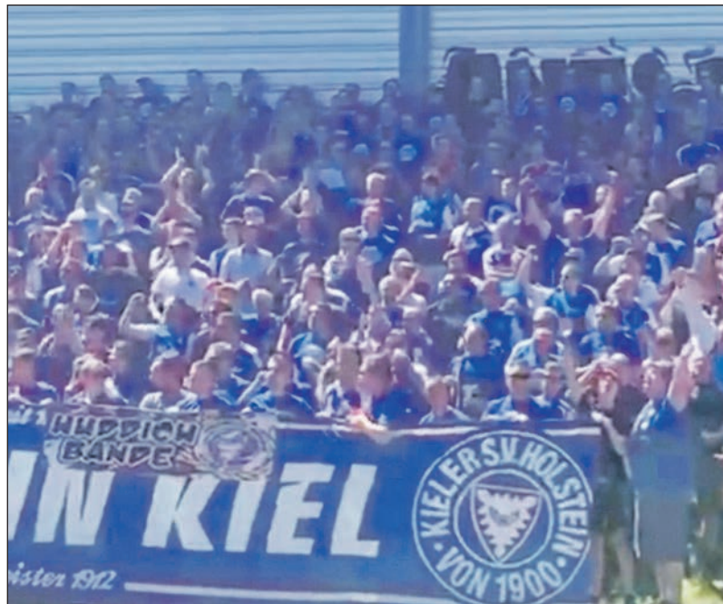
Freuen sich auf Neuzugang Nummer vier: Die KSV-Anhänger

Kreis Plön (dif). Sommerpause und Kassensturz auch bei der KSV Holstein. Die Corona Pandemie der letzten zwei Jahre ist auch am Zweitligisten nicht spurlos vorbeigegangen. Aktuell erhalten die Dauerkartenbesitzer die „Ticket Gelder der Geisterspiele“ in Form eines Gutscheines für den KSV-Fanshop zurück. Eine Auszahlung in Euro wie im ersten „Seuchenjahr“ wäre auch für die Störche aktuell ein kaum machbarer finanzieller Kraftakt. Aber keine überall gängige Methode für die Anhängerschaft. Bei Vielen drängt sich die Frage auf: Haben sich Verein und Fans zu weit voneinander entfernt? Eine Berechtigte in der aktuellen Zeit. Postete vor Jahren Franck Ribery, damals in Diensten des FC Bayern, das berühmte Steak aus Blattgold, so war es vor einem Jahr Lionel Messi, der sich aus finanziellen Gründen (!) mit