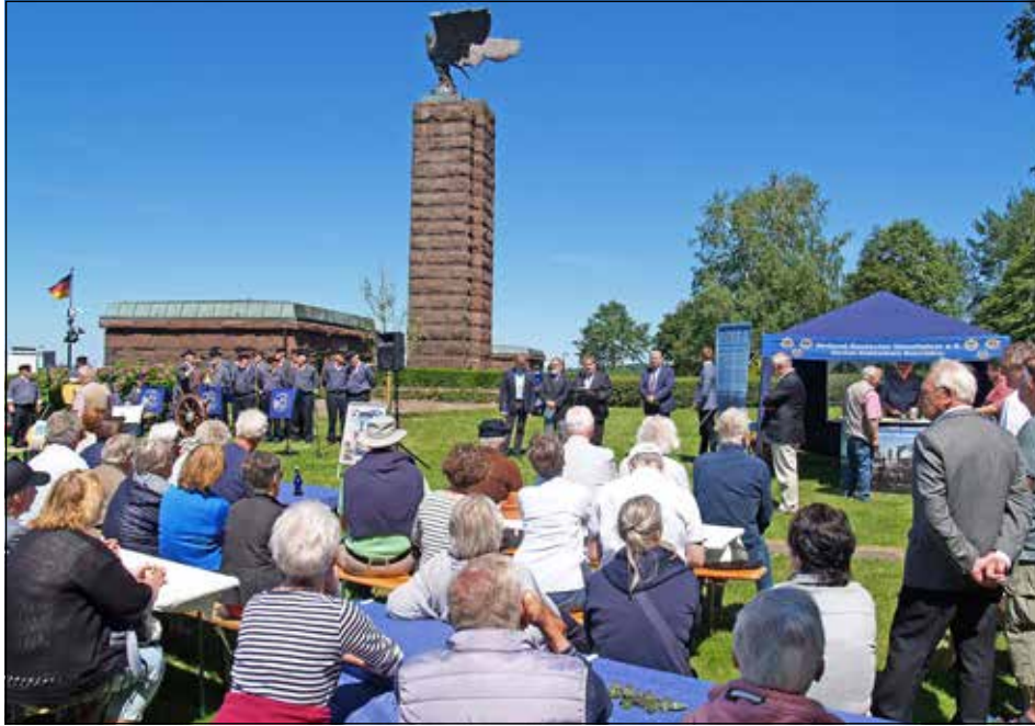
Am 19. Juni ist Tag der Offenen Tür am Ehrenmal Möltenort.

Möltenort (t). Das U-Boot-Ehrenmal auf der Möltenorter Schanze in Heikendorf ist dem Gedenken der auf See gebliebenen deutschen U-Bootfahrer und aller Opfer des U-Bootkrieges gewidmet. Mehr als 35 000 Namen sind auf den Bronzetafeln verewigt. Das Ehrenmal ist ein Ort des Gedenkens, der Erinnerung und Besinnung sowie der Mahnung gegen Krieg und Gewalt. Zum Auftakt der Kieler Woche laden der Volksbund Deutsche Kriegsgräberfürsorge e.V. und die Ubootkameradschaft Kiel e.V. am Sonntag, den 19. Juni, von 10