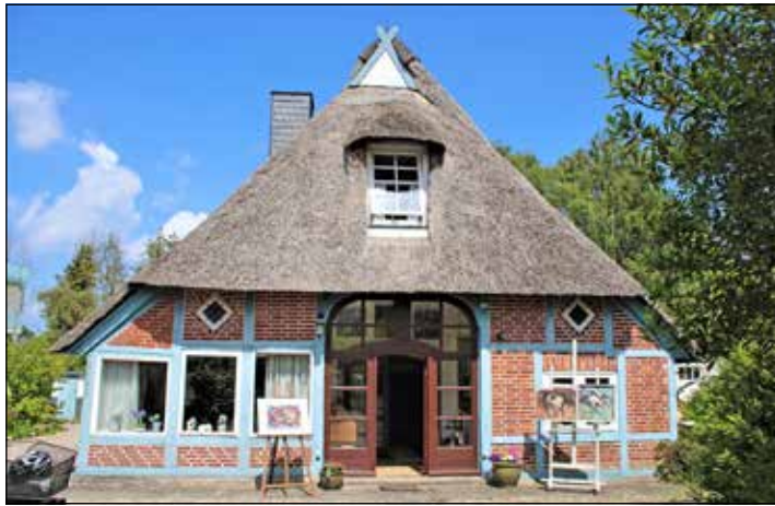
Das Behrend-Haus in Neuheikendorf