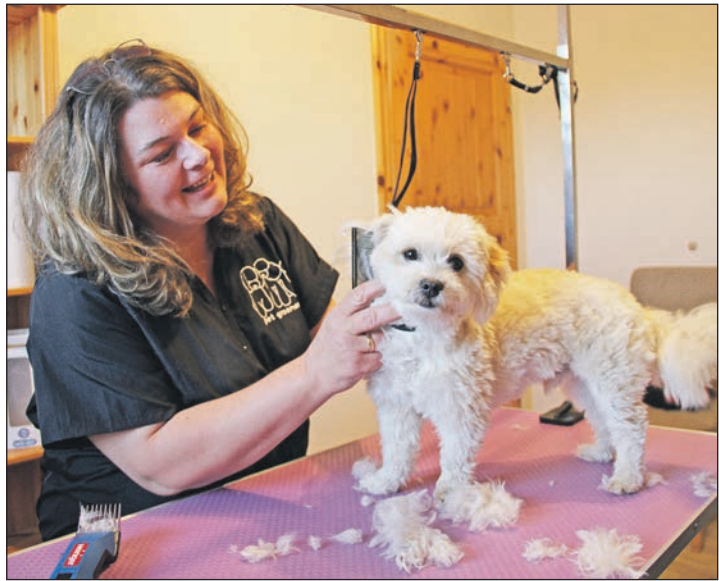
Ein perfekter Schnitt erfreut den Halter und schützt das Tier.

beispielsweise bei einer Tasse Kaffee gemütlich miteinander“, hob sie freudestrahlend ihre bewährte Arbeitsweise hervor. Als gelernte und zertifizierte Fachkraft schätzt sie den gewaltfreien Umgang mit dem Tier hoch ein. „Während meiner 3jährigen Ausbildungszeit in einem anerkannten