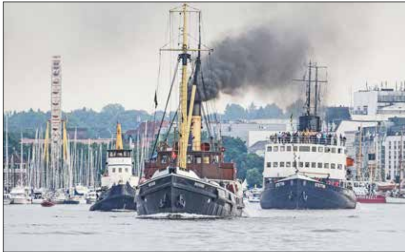
Rund um die Förde raucht und dampft es prächtig beim großen Dampf-Hafen-Fest in Flensburg zu Wasser und am Land.

Heikendorf/Schönberg (t). Deutsch-Dänische Top-Events im attraktiven Doppelpack erleben unsere Leser bei der großen Bus-Sonderfahrt der Probsteer-Leser-Reisen ab Preetz, Schwentinental und Kiel am 10. Juli (Sonntag) ins Grenzland und Süd-Jütland: Zunächst genießen die Probsteer-Leser nach der komfortablen Anreise in der dänischen Hafenstadt Sonderburg Nord-Europas größtes Ringreiter-Fest mit einem imposanten Festumzug vom Schlossplatz am Hafen durch die Gassen der Stadt mit zahlreichen dänischen und internationalen Musik-Kapellen, Trachtengruppen und mehr als 500 Ringreiter hoch zu Pferde auf dem Weg zum Festplatz, wo auch unsere Leser während der Freizeit die Gelegenheit haben, sich an der kulinarischen Meile mit dänischen Spezialitäten zu stärken und das muntere Ringreiter-Fest beobachten können. Anschließend geht es entlang der Düppeler Schanzen und der zauberhaften „Dänischen Riviera“ auf kurzem Weg, mit einem Stopp an der berühmtesten Hot-Dog-Bude der Welt bei „Tante Anni“ direkt am Fjord, weiter in die Rumstadt Flensburg, wo Europas größtes Dampf-Fest „Dampf-