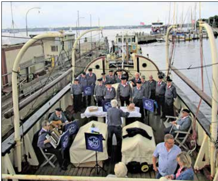
Seemannslieder vom Shantychor „De Brummelbuttjes“.