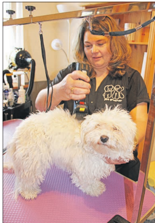
Nach der Fellpflege wird mit dem Scheren begonnen.

als Hundefriseurin und Groomerin. Stets steht für sie das Tier dabei im Vordergrund. „Bereits beim ersten Treffen mit dem Hund und seinem Halter ist mir wichtig, dass eine angstfreie Atmosphäre herrscht. Ich nehme mir viel Zeit, mit dem Tier ein Vertrauensverhältnis aufzubauen und wenn Frauchen oder Herrchen es wünschen, können sie ihren Liebling gerne in meinem „Hundesalon Pfötchenschön“ begleiten. Hierdurch sind auch schon einige Freundschaften entstanden und neben der Tierpflege plaudern wir dann