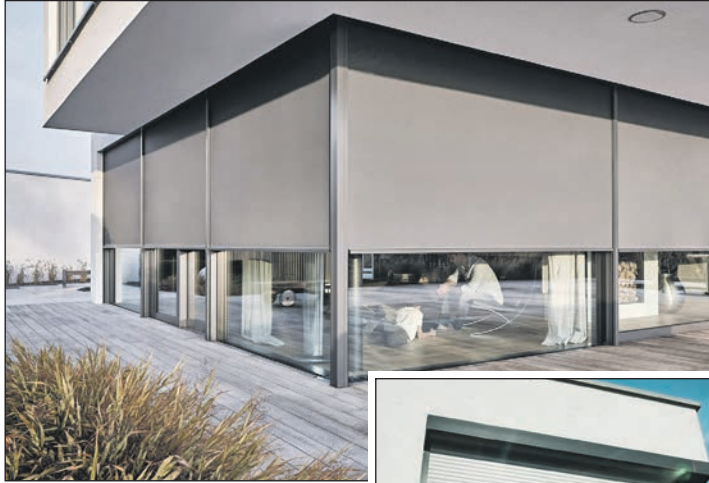
Außenliegender Sonnenschutz wie Außenjalousien oder Textilscreens wirken meist am besten.

Schnell nachgerüstet sind innen liegende Sonnenschutzlösungen, beispielsweise in Form von Jalousien, Faltstores, Rollos, Plissees und Vorhängen. Viele Hersteller bieten hier maßgenau gefertigte