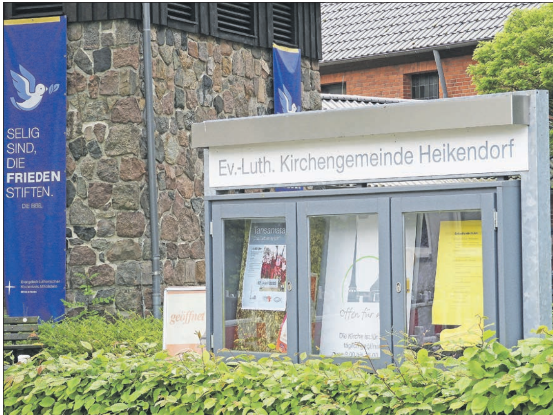
Die Kirchengemeinde Heikendorf arbeitet einen Missbrauchsfall von 1972 auf.

Und auch, wenn Wiedergutmachung als Wort nicht taugen mag: Die Kirche will „Felix“ mit seinen schmerzlichen Erinnerungen und deren Folgen nicht allein lassen. Nicht nach 50 Jahren und auch in Zukunft nicht. Hinweise können an Pastor Joachim Thieme-Hachmann, Telefon 0431 - 2487711, pastor.thieme-hachmann@kirche-heikendorf.de, Pröpstin Almut Witt, Telefon 0431 - 2402300, proepstin.kiel@altholstein.de, UNA (Unabhängige Ansprechstelle für Menschen, die in der Nordkirche sexuelle Übergriffe erlebt oder davon erfahren haben), Telefon 0800 - 022 0099, una@wendepunkt-ev.de gegeben werden.