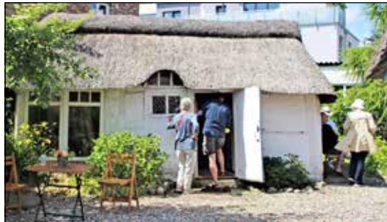
Das Atelierhaus (Tradition und Fortschritt?)