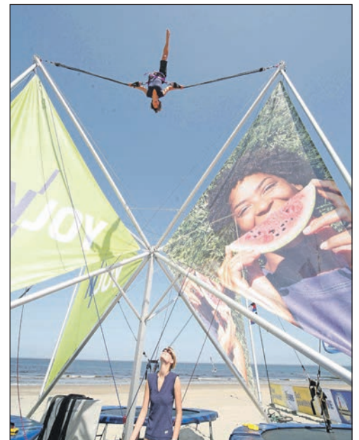
Spielmacher aus Laboe schickt große und kleine Besucher in die Lüfte.

Die Sprungeinrichtung hat es „in sich“ und ist bekanntlich nichts für schwache Nerven. Bis zu neun Meter Höhe können die Teilnehmer beim Springen erreichen und