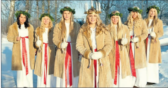
Den großen Lucia-Festumzug in Malmö genießen unsere Leser zum traditionellen schwedischen Lichterfest

zum Shopping-Bummel oder zum Besuch der Weihnachtsmärkte auf der dänischen Seite des Öresundes in der prachtvoll geschmückten Hauptstadt Kopenhagen, be-