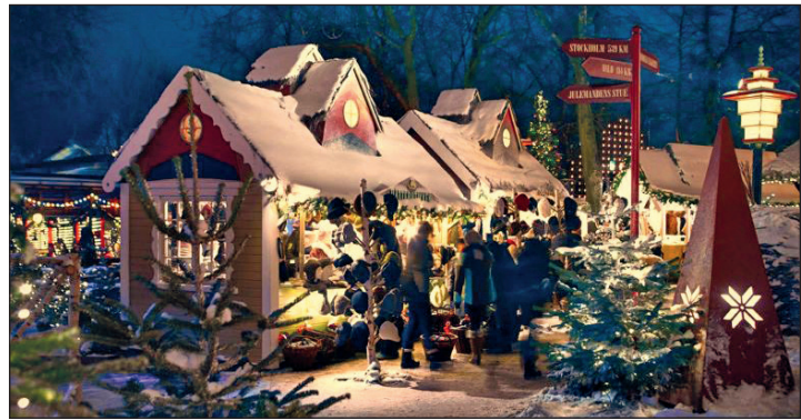
Skandinavische Weihnachtsmärkte mit viel „Hygge“ erwarten unsere Leser in Malmö und Kopenhagen

vor die Rückreise am Nachmittag in die Heimatorte erfolgt. Anmeldungen sind ab sofort möglich bei den Probsteer-Leser-Reisen des Burg-Verlages in