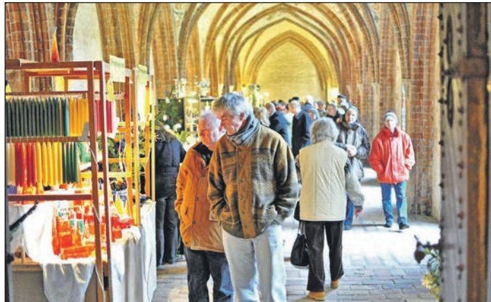
Weihnachtsstände aus Dänemark und Deutschland erwarten unsere Leser beim „Weihnachts-Schwalmarkt“ an der Schlei.

großen Gotteshauses mit vielen weihnachtlichen Ständen aus Dänemark und Deutschland die Besucher begeistern wird. Am Nachmittag genießen unsere Leser sodann eine „musikalische Weihnachtsstunde im Dom“ inklusive Eintritt mit Weihnachtsgeschichten und weihnachtlichen Liedern. Zudem lockt der erlebnisreiche Weihnachtsmarkt