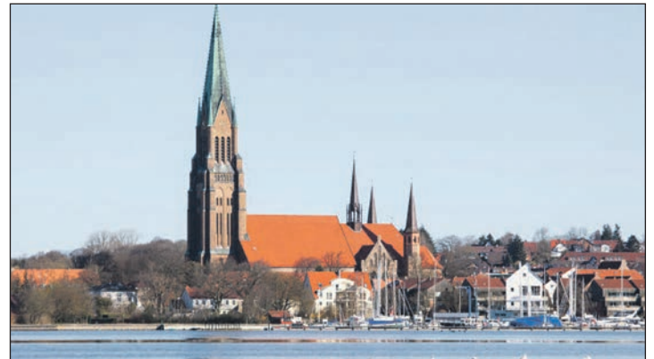
Das Gotteshaus wird zum großen Weihnachtsmarkt: Unsere Leser im berühmten Dom an der Schlei in Schleswig besonders stimmungsvolle Vorweihnachten mit vielen Ständen und weihnachtlicher Musik.

der Schlei werden unsere Leser im schönen Landhaus-Restaurant am See zum großen Grünkohl-Buffer „satt“ sowie vielen weiteren Spezialitäten vom Schleswig-Holstein-Buffer mit großem Dessert-Buffer eingeladen. Anschließend führt der Kurs Nord