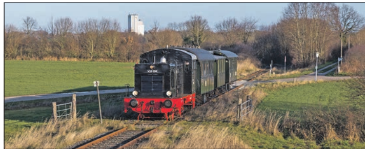
Die Museumsbahn rollt am Sonntag, 4. Dezember wieder durch die Probstei.

ber im Einsatz. Die versprechen eine gemütliche Tour durch die Landschaft. Prominentester Fahrgast ist dabei der Nikolaus. Und der hält für alle Mitfahrer zwischen 3 und 14 Jahren sogar eine kleine Überraschung bereit. Der Ausflug mit der Museumsbahn hat eine Dauer von rund 45 Minuten und endet wieder in Schönberger Strand am Bahnhof. Dort besteht auch die Möglichkeit zu einer Fahrt mit einer der historischen Straßenbahnen, die vor Ort über das Museumsgelände kreisen. Die Nikolausfahrt kostet 7 Euro pro Fahrgast. Der Preis gilt ab 3 Jahren. Begleitete jüngere Kin-