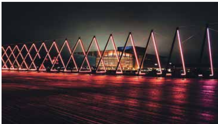
Einzige Licht-Illuminationen in der City und am Hafen begeistern die Besucher beim Licht-Festival in Kopenhagen.

Ausserdem können unsere Leser mit Einbruch der Dunkelheit am Nachmittag viel Licht im skandinavischen Winter entdecken mit dem „Copenhagen Light Festival“ in der City mit traumhaften Licht-Illuminationen an historischen Gebäuden und den Kanälen der Stadt, deren Licht-Kunstwerke Besucher aus ganz