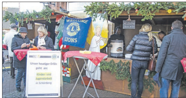
Kartoffelpuffer und Fliederbeerpunsch – ein „Renner“ am Stand des Lions Clubs Wagrien, der auf dem Schönberger Weihnachtsmarkt 2022 wieder für gute Zwecke in Aktion ist.