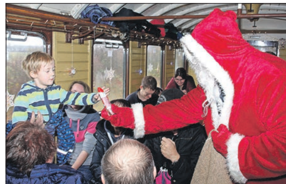
Für die Kinder gibt es eine kleine Überraschung.

Museumsbahnen am Schönberger Strand, wo seit 1993 historische Straßenbahnen aus Hamburg, Kiel, Hannover, Braunschweig und Berlin zu besichtigen und