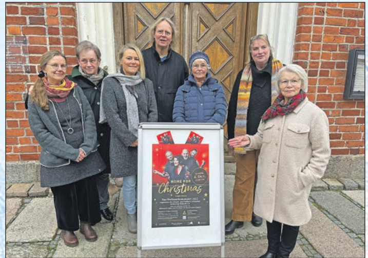
Werben für die Benefizveranstaltung „Home for Christmas“: Die Mitglieder des ambulanten Hospizvereins Lütjenburg.

Die vier Musiker begeistern mit wechselnden Gastmusikern das Publikum auf einer Reise durch die internationale Weihnachtswelt. Neben englischen Carols, Gospels, amerikanischen Christmas-Songs, deutschen Liedern