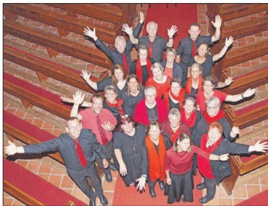
Musikalische Weihnachtsfreude: Giekauer Gospelchor Joyces singt am 2. Advent.

Giekau (t). Der Giekauer Gospelchor Joyces lädt zu seinem Weihnachtskonzert am Sonntag, 4. Dezember in der Giekauer St. Johanniskirche ein. Der Eintritt zum Konzert ist frei, eine Kollekte wird am Ausgang erbeten. Unter dem Motto „There´s