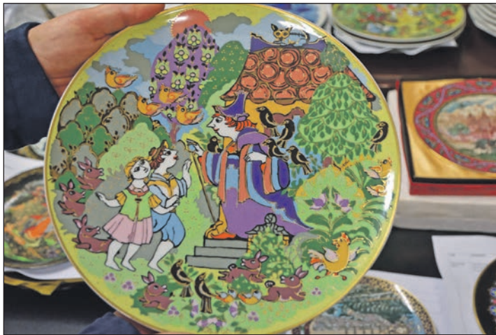
Farbenfroh und unverkennbar: „Hänsel und Gretel“ bei ihrer verhängnisvollen Begegnung am Knusperhäuschen.

die in der großen Halle gezeigt werden. Zu „Aschenputtel spült keine Teller ... von Märchen und Legenden“ gibt Dr. Serafine Christine Kratzke aus Dithmarschen anlässlich der Eröffnung eine Einführung und beleuchtet das Thema aus seinen verschiedenen Blickwinkeln.