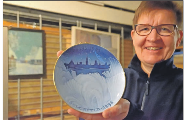
Der Oldenburger Künstler Kay Konrad ließ sich durch „De Fischer un' sin Fru“ zu diesem Gemälde inspirieren.

Märchen der verschiedenen Kulturen und Regionen bilden den thematischen roten Faden der vielgestaltigen Ausstellung im Heikendorfer Künstlermuseum. Dieser findet sich auf über 50 meisterhaft gestalteten Porzellantellern aus einer privaten Sammlung sowie in ganz unterschiedlichen Gemälden und Grafiken,