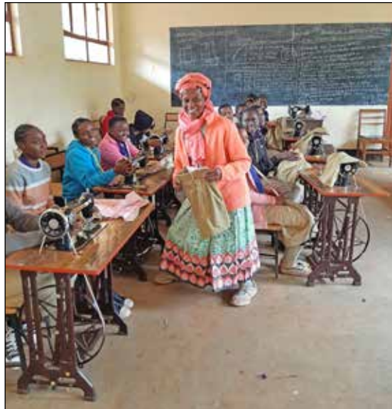
Spenden für Schulunterricht für die Kinder von Mrimbo - dafür wirbt das Heikendorfer Tansania-Team.

Auch wenn der Ukraine-Krieg weit weg von Tansania ist, ist der Einfluss dort deutlich zu merken, informiert die Tansaniagruppe, die enge Kontakte nach dort pflegt. „Alle Importwaren, wie Weizen, Dünger und Treibstoffe, sind bis zu 100 Prozent teurer geworden. Die Inlandprodukte, wie Mais, Obst und Gemüse, können diesen Preisanstieg nicht kompensieren - weil Dünger und Treibstoffe so extrem teuer geworden sind.“ Die Verteuerung beeinträchtigt viele Familien. Doch diese haben bereits schon vor den Krisen (Klimakrise, Coronapandemie, Ukrainekrieg) an der Armutsgrenze von 1,9 $ (in diesem Jahr auf 2,15 $ erhöht) pro Tag gelebt. In Tansania lebten heute mehr als 50 Prozent der Bevölkerung unter der Armutsgrenze, was aus der Perspektive des hiesigen Lebensstandards kaum vorstellbar ist. „Ob Klimawandel, Pandemien oder Kriege, es trifft immer die Ärmsten am schlimmsten“, verdeutlichen die Heikendorfer Ehrenamtler. Die Armut bedeute auch, dass viele