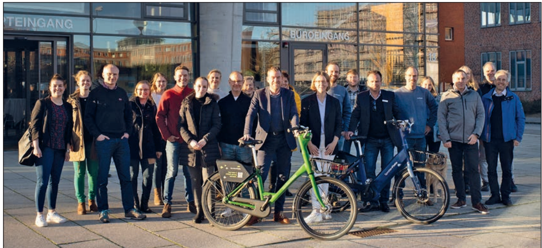
Ulf Kämpfer, Oberbürgermeister der Stadt Kiel und Aufsichtsratsvorsitzender der KielRegion, präsentiert ein Fahrrad im Design des neuen Servicedienstleisters Donkey Republic Admin ApS aus Kopenhagen.

Neu ist, dass auch die E-Bikes künftig an jeder Station ausgeliehen und abgegeben werden können. Die Kosten für die Nutzung der SprottenFlotte ändern sich durch den Systemwechsel nicht.