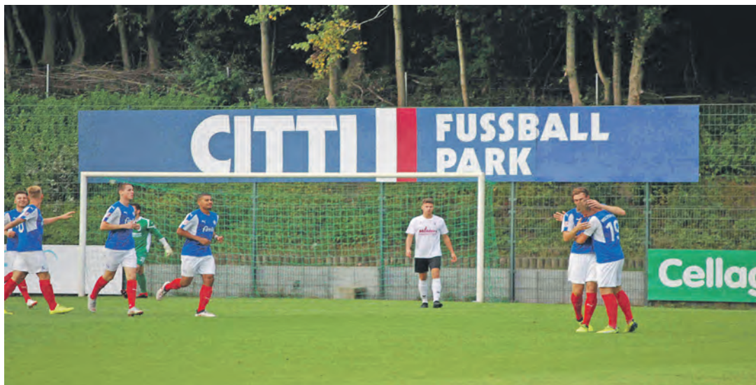
Die U23 Holsteins hatte oft Grund zum Jubeln.