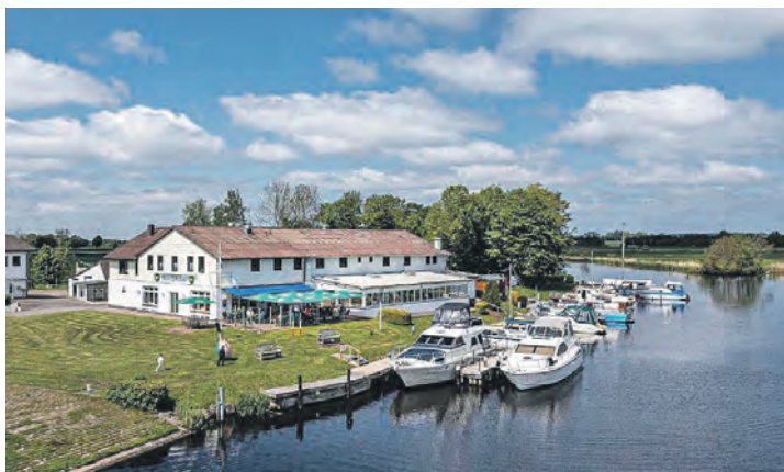
Im berühmten Fährhaus an der Eider erwartet die Leser das große Winter-Schlemmerbuffet mit vielen regionalen Spezialitäten.

Fährhaus an der Eider zum sehr großzügigen Winter-Schlemmerbuffet mit Spezialitäten aus Schleswig-Holstein und Grünkohl mit allen Beilagen sowie knusprig-leckerem Dithmarscher Spanferkel – frisch aus dem Rohr – mit vielen knackig-frischen Gemüsebeilagen aus der Eider-Region, vielfältigen Kartoffel-Variationen, Dips und Saucen sowie großem und marktfrischen Salat-Buffer und zum Finale ein leckeres Dessert-Buffer.