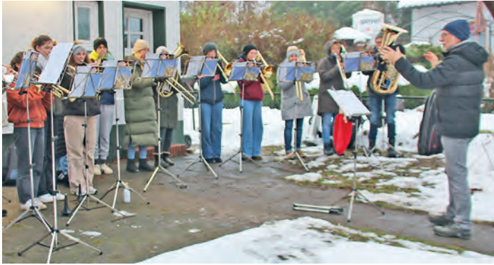
Der Posaunenchor der Kirchengemeinde Schönkirchen stimmt an mehreren Orten musikalisch auf die Weihnachtszeit ein.

Schönkirchen (t). Auch in diesem Jahr macht sich der Posaunenchor der Kirchengemeinde Schönkirchen wieder auf den Weg, um an verschiedenen Orten auf die Weihnachtszeit einzustimmen. An diesen Stellen werden am Sonabend, 13. Dezember, Choräle, Weihnachtsli-