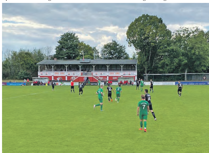
Gut aber nicht herausragend: Die Kilia-Hinrunde.

gestoppt durch eine Niederlage am grünen Tisch (Nichtantritt bei Nordmark Satrup) thronen die Todesfelder weit oben in der Liga und sind nach jetzigem Stand der Dinge wohl kaum auf ihrem Zug zum Titel aufzuhalten. Für die