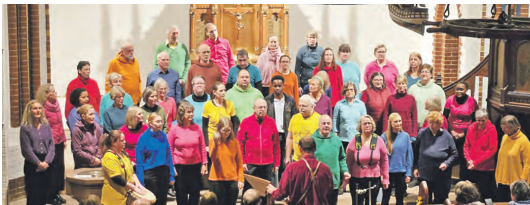
Der Gospelchor Holtenau begeistert das Publikum mit rhythmischer Kirchenmusik.

Kiel (t). Der Gospelchor Holtenau und der LionsClub „Kiel oben“ laden zu einem Benefizkonzert in die Nikolaikirche am Alten Markt ein. Die Veranstaltung findet am Samstag, 13. Dezember, um 19 Uhr statt. Der Eintritt ist frei, es werden Spenden gesammelt. Der Erlös geht an den Wünschewagen Kiel („Einen letzten Wunsch erfüllen“) und an den Freundes- und Förderkreis der Kirchenmusik in Holtenau für die Unterstützung von Chorprojekten. Der Chor singt seit 30 Jahren südafrikanische und nordamerikanische Kirchenmusik. Zum Programm gehören bekannte Ti-