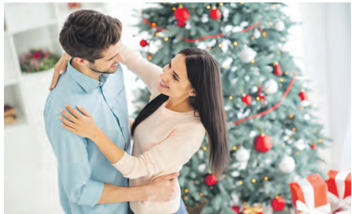
Tanzgutscheine sind immer ein guter Geschenktipp zum Weihnachtsfest.

Tanzschule Tessmann Kirchhofallee 25 in Kiel Tel.: 0431 / 676767 www.tanzschule-tessmann.de