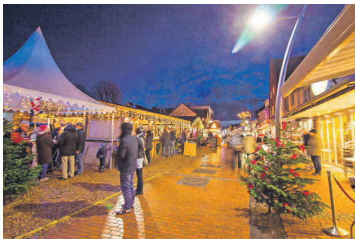
Der „Büsumer Winterzauber“ ist ein traumhafter Wintermarkt mit vielen regionalen Spezialitäten aus Dithmarschen.

Gut gestärkt geht der Erlebnis-Törn weiter ins mondäne Seebad Büsum, wo die Leser ein zauberhafter Wintermarkt im Herzen der Stadt zwischen Rathauspark und Fußgängerzone mit vielen Ständen und Buden und herzhaften Spezialitäten aus Dithmarschen erwartet. Alternativ lockt während des Aufenthaltes ein traumhafter Winter-Spaziergang direkt am Meer auf der eindrucksvollen