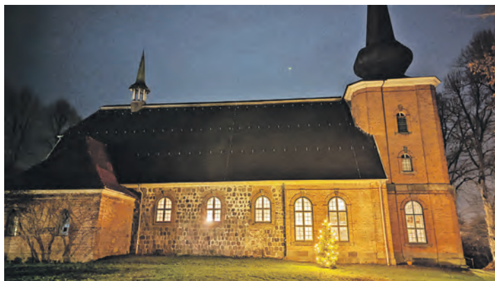
Blickfang in der dunklen Jahreszeit: die St. Katharinen-Kirche bei Nacht.

statt. Der Eintritt kostet 10 Euro. Karten gibt es an der Abendkasse, die ab 17.30 Uhr öffnet. In der Evangelisch-Lutherischen Kirche Heikendorf beginnt die Veranstaltung am Sonntag, 14. Dezember, ebenfalls um 18 Uhr. Der Eintritt ist frei, um eine Spende wird gebeten. Einlass ist ab 17.30 Uhr. Nach diesem Konzert besteht wieder die Gelegenheit, die Aktion „Chickens for Christmas“ der Tansaniagruppe der Gemeinde zu unterstützen, um bedürftigen Familien in den Partnergemeinden Rimbo und Uchira ein Weihnachtsessen zu ermöglichen.