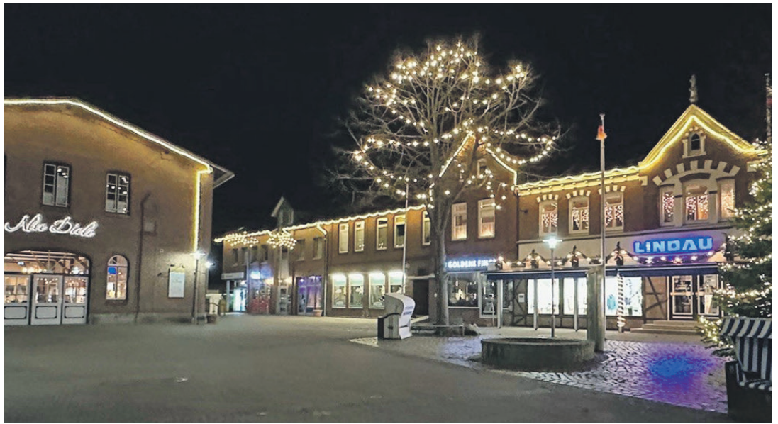
Schönberg erstrahlt zur Weihnachtszeit in warmem Lichterglanz.

Schönberg (t). Die Adventszeit ist, neben vielen gemütlichen Stunden mit seiner Familie, auch immer mit dem einen oder anderen besonderen Einkaufsbummel verbunden. Schönberg hält dafür eine schöne Bandbreite von Einzelhandelsgeschäften bereit. Denn wer möchte nicht seine Lieben mit einem schönen und individuellen Geschenk am Heiligabend überraschen? Ganz nach dem Motto „Gemeinsam sind wir stark“ ziehen die Gewerbetreibenden an einem Strang und bieten ihren Kunden in der Adventszeit viele gemütliche Einkaufs-Events. Der Weihnachtsbummel beginnt in der Fußgängerzone entlang der stimmungsvoll illuminierten Bäume und Schaufenster und setzt sich fort in Richtung Bahnhofstraße. Die hat reichlich Abwechslung zu bieten. Die Kunden finden in den gut sortierten Fachgeschäften vor allem eine kompetente Beratung und einen persönlichen Service vor. Viele Geschäfte öffnen an den Samstagen im Dezember bis in den späten Nachmittag, die Supermärkte haben oft länger ge-