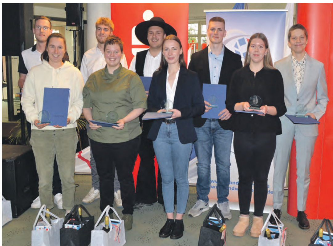
Die anwesenden Landessiegerinnen und Landessieger nach ihrer Auszeichnung

In ihrem Grußwort zeigten sich auch die Kreispräsidentin-