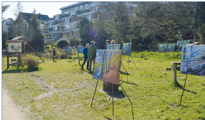
Zahlreiche Passanten nutzten am ersten Ausstellungstag die Gelegenheit, die Bilder zu betrachten – auch ohne offizielle Eröffnungsfeier.

Weitere Infos zur Ausstellung sind im Internet zu finden unter: https://iw-foto.de/waldgalerie-2021/ausstellung-bad-schwartau-2021