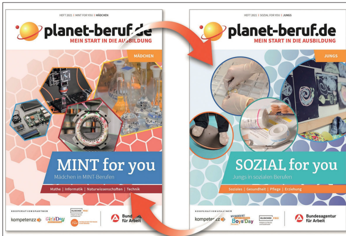
Das planet-beruf.de-Heft ermutigt Jugendliche, neue Wege bei der Berufswahl zu gehen.

Beruf zu finden. Lassen Sie sich zu den Möglichkeiten beraten“, bietet Markus Dusch, Chef der Agentur für Arbeit Lübeck, an. Gespräche können unter der regionalen Hotline 0451/588-501 oder online unter www.arbeitsagentur.de/eServices vereinbart werden.