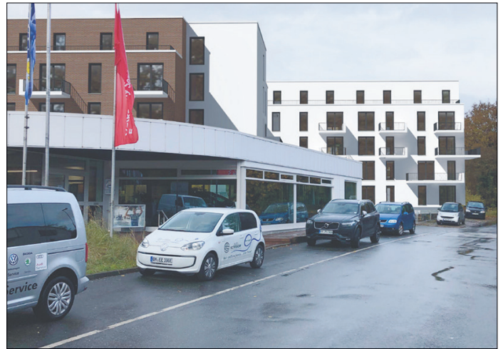
... und in dieser Fotomontage nach der geplanten Bebauung.

einen Neubau auf der gegenüberliegenden Straßenseite zu verbinden. Diese Form der Bebauung in diesem Gebiet lehnen wir strikt ab. Es ist davon auszugehen, dass sich der Charakter und die ursprünglichen Strukturen von Klein Timmendorf in den nächsten Jahren durch diese Einwirkungen stark verändern werden. Wir sprechen uns ausdrücklich nicht gegen eine moderate Wohnbebauung aus und möchten insbesondere auch die Existenz der bestehenden Gewerbebetriebe nicht gefährden. Wir haben uns jedoch in den entsprechenden Gremien der Gemeinde dafür eingesetzt, das gesamte Gebiet unter Berücksichtigung aller weiteren geplanten weiträumigen Veränderungen zu entwickeln und nicht nur auf einzelne Projekte abzustellen, die im Sinne der Investoren zügig realisiert werden sollen. Insbesondere sollte die zugehörige Infrastruktur entsprechend zukunftsorientiert nach den Bedürfnissen und dem Verkehrsaufkommen gestaltet werden.“