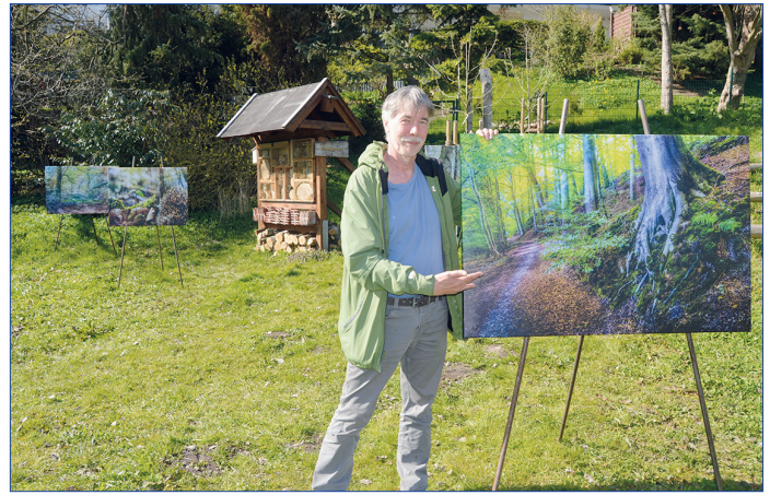
Elf sehenswerte Bilder zeigt der in Bad Schwartau lebende Fotograf Ingo Wandmacher im Bad Schwartauer Kurpark.

„Die Arbeiten entstanden in den Wäldern von Bad Schwartau und zeigen die Schönheit unserer unmittelbaren Umgebung“, so Rudolf