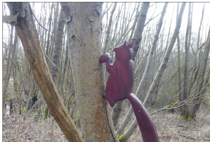
Beim Passieren des Bohlenwegs können kleine, aber auch große Entdecker seit Kurzem nach tierischen Bewohnern Ausschau halten.

Naturerlebensraum Schwartautal ist nun um eine Attraktion reicher geworden. Seit ein paar Tagen können kleine und große Gäste beim Passieren des Bohlenwegs Ausschau nach neuen tierischen Bewohnern halten. Auch wenn sich echte Tiere nicht blicken lassen, kann man links und rechts des Bohlenwegs und auch in den Bäumen eine Eule, ein Eichhörnchen, ein Reh, einen Hasen, ein Wildschwein und einen Fuchs entdecken. Das Eichhörnchen hat sich besonders gut versteckt. Damit die bodennahen Tiere bei Hochwasser nicht wegschwimmen, wurden sie gut arretiert. Die „Aktion Tierfiguren“ konnte aus Spendengeldern an den Umweltbeirat mitfinanziert werden. „Der Umweltbeirat wünscht allen Besuchern viel Freude und Spaß beim Suchen“, so der Beiratsvorsitzende Rudolf Meisterjahn.