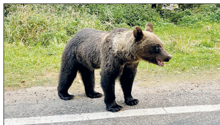
Die Reise führte das Ehepaar aus Techau oftmals in unberührte Natur. In den Karpaten trafen sie dabei auch auf wildlebende Bären.

Schließlich folgte der vorläufig letzte Teil der Hinfahrt ans Schwarze Meer. So lange, wie ihre Roadtripp letztlich dauerte, war er ursprünglich gar nicht geplant. „Wir hatten eine Reise nach Jordannien gebucht. Am 16. November sollte es eigentlich losgehen, aber Ende Oktober kam die Nachricht, dass die Reise nicht stattfinden kann und storniert wird“. Also verlängerten die Techauer ihre Tour und machten sich noch auf den Weg nach Bulgarien und Griechenland. Weiter ging es dann mit der Fähre nach Bari in Italien und schließlich zur letzten Station vor der Rückreise nach Sizilien. „Insgesamt haben wir auf unserer Reise viele unbekannte Gegenden und unberührte Landschaft entdeckt. Das war schon traumhaft. Beeindruckend war aber auch der Besuch des ‚Dracula-Schlusses‘ in Rumänien und der Aufstieg auf den Ätna am Ende unserer Reise. Wir haben da in den Schlund geguckt. Da rauchte der Vulkan schon. Nur wenige Wochen danach ist er dann ja auch ausgebrochen.“ Und auch die Rückreise über den Brenner bleibt wohl unvergessen. Wenn auch aus anderen Gründen. „In Italien ist Benzin recht teuer. Also wollten wir, ohne zu tanken, bis nach Österreich durchfahren. Das war schon knapp“, erklärt Archibald Průß. Dabei kamen ihm seine Ortskenntnisse