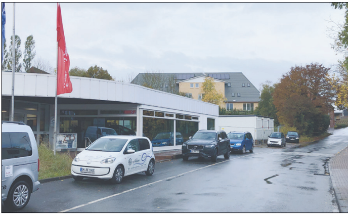
Die Straße „Vogelsang“ beim Autohaus Schneider heute ...

Tdf. Strand. Die Wählergemeinschaft „BürgerBündnis Neue Perspektive“ (BBNP) in Timmendorfer Strand möchte die Bürger*innen der Gemeinde - und insbesondere die Bürger*innen aus Klein Timmendorf - ermuntern, beim weiteren Verfahren zur Änderung des Bebauungsplans 40 weiterhin aufmerksam zu bleiben und die weitere Entwicklung kritisch zu begleiten. In einer aktuellen Pressemitteilung von BBNP heißt es „Wie bereits in einem Artikel in den Lübecker Nachrichten vor einigen Tagen von Anwohnern angemerkt, wird diese B-Plan-Änderung massive Auswirkungen auf den früheren Ortsteil Klein Timmendorf haben.“ Das betroffene Gebiet der geplanten Änderung erstreckt sich über die Kreuzung B76/Hauptstraße bei Firma Brandenburg über den Vogelsang bis zur L180, der Verbindungsstrecke von Timmendorfer Strand und Hemmelsdorf. Diese Änderung sieht in dem Gebiet ein sogenanntes „Urbanes Gebiet“ vor, bei dem es sich planungsrechtlich