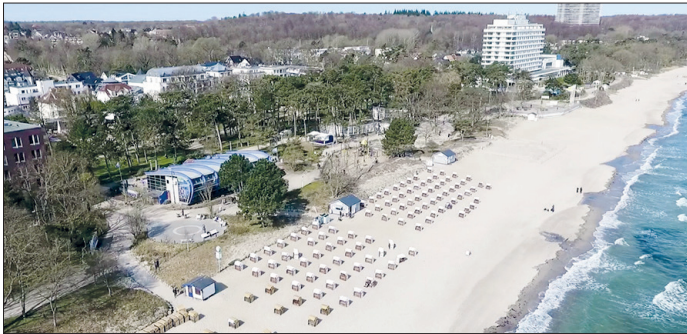
Timmendorfer Strand: Ein leerer Strand ohne Seebrücke und ohne Urlaubsgäste.

Lübecker Bucht. Seit der Bewerbung der inneren Lübecker Bucht zur touristischen Modellregion, hat sich das Infektionsgeschehen in Ostholstein dynamisch entwickelt. Lag der Inzidenzwert am 7. April noch bei 43,4, so stand er am Dienstag, dem 20. April, bei 71,8 (Website des Landes Schleswig-Holstein) und bei Redaktionsschluss am Freitag bei 85,3. Diese Entwicklung hat Konsequenzen für den Start des Modellprojektes, das in den Orten von Niendorf bis Retzin eine vorsichtige und wissenschaftlich begleitete Öffnung des Tourismus vorsieht.