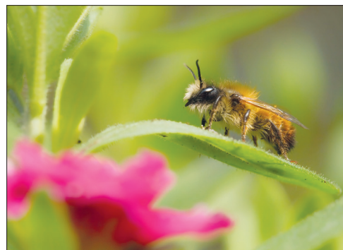
In Deutschland gibt es neben der Honigbiene 560 verschiedene Wildbienenarten, etwa die Hälfte davon ist bereits gefährdet.

– für Insekten, Feldvögel und Säugtiere. Wissenschaftler des Mannheimer Instituts für Agrarökologie und Biodiversität haben herausgefunden, dass Blühflächen ohne Nutzung die Insektenvielfalt verdreifachen. Feldvögel wie Feldlerche, Braunkehlchen oder Rebhuhn profitieren besonders von Extensivgetreide mit Untersaat: Die Bestände sind dreifach höher als bei konventioneller Bewirtschaftung. Blühflächen zur Energiegewinnung haben auf Insekten, Feldvögel und Feldhasen gleichermaßen einen messbaren positiven Effekt. Für mehr Artenvielfalt sollten rund 20 Prozent der Ackerflä-