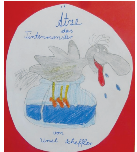
Die Schülerinnen und Schüler der zweiten Klassen der GGS-Strand Europaschule freuten sich über die Buchspende „Ätze, das Tintenmonster“.

aber ein „Tintenmonster“ noch nicht. Offensichtlich hat es den Kindern Spaß gemacht, das Monster zu begleiten, denn nun kamen fröhliche Rückmeldungen von den „eifrigen Leser*innen aus Kl. 2a und b“. Vielleicht vergisst ja jemand eine Tintenpatrone in der Schule, dann kann auch „Ätze“ die Ferien genießen. Kinderherz e.V. wünscht jedenfalls allen Schulkindern und Lehrkräften gesunde, unbeschwerte Ferientage und einen guten Neustart.