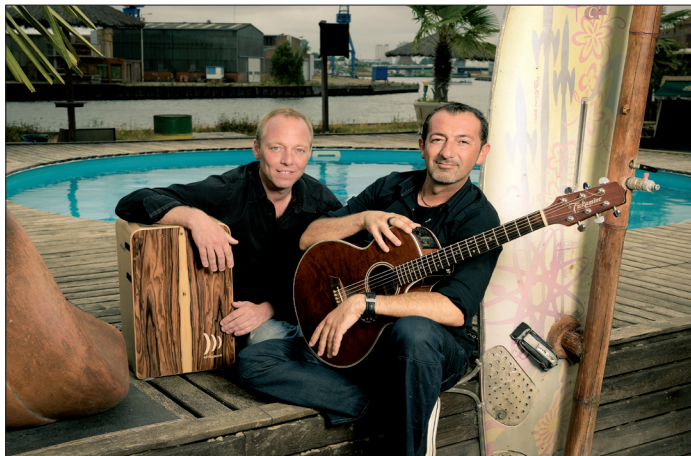
Urban Beach sorgen am Samstagabend für die richtige Musik beim Hafenkonzert in Niendorf/Ostsee.

Der Eintritt ist kostenfrei. Bei Regen kann das Hafenkonzert leider nicht stattfinden.