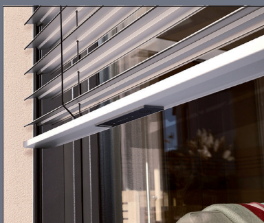
Auch zur Nachrüstung ist das System geeignet, da es eine eigene Spannungsversorgung besitzt, also unabhängig vom Stromnetz funktioniert.

Geborgenheit und Sicherheit machen das Zuhause zum wichtigsten Rückzugsort. Doch jährlich gibt es in Deutschland rund 85.000 Einbruchversuche. Damit es beim Versuch bleibt, braucht ein Objekt eine gute Sicherung. Ein Hersteller hat daher ein Frühwarnsystem zum Schutz vor Einbrechern eingeführt, das auf ungewöhnliche Bewegungen des Raffstores mit einem lauten Signal reagiert. Der akustische Signalgeber erfasst alle Bewegungen des Raffstores und wertet diese aus. Sollten sich Einbrecher am daran zu schaffen machen, entstehen untypische Bewegungen, die sich von denen bei gewöhnlicher Nutzung und Witterungseinflüssen unterscheiden. Diese erkennt das