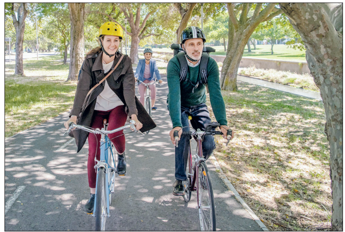
Viele Menschen im Kreis Ostholstein haben während der Corona-Pandemie das Rad für sich neu entdeckt und nutzen es, um mobil zu sein und etwas für ihre Fitness und Gesundheit zu tun.

Neben mehr Gesundheit und Umweltschutz warten auch attraktive Preise, die von Drittfirmen gespendet wurden, auf die Teilnehmer. Darunter sind hochwertige Fahrräder und Fahrradzubehör. In Schleswig-Holstein wird als Sondervettbewerb auch in diesem Jahr erneut das „fahrradaktivste Unternehmen“ im Land zwischen den Meeren gesucht: Wer es seinen Beschäftigten ermöglicht, das Rad für den Weg zur Arbeit zu nutzen, erhält einen Extra-Preis in Höhe von 500 Euro für eine fahrradfreundliche Investition, wie zum Beispiel einen sicheren und überdachten