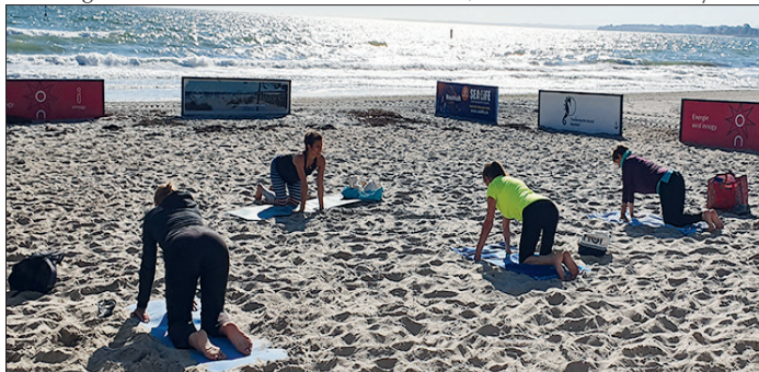
Seit Anfang Juni wird am „SportStrand“ in Timmendorfer Strand wieder ein abwechslungsreiches, kostenloses Programm angeboten.

Vom 16. August bis 31. August werden die Kurse im Strandpark unterhalb der Trinkkurhalle stattfinden, da der Strandabschnitt für die Deutschen Beachvolleyball Meisterschaften genutzt wird. Die Volleyballfelder können zu dieser Zeit leider nicht zur Verfügung stehen.