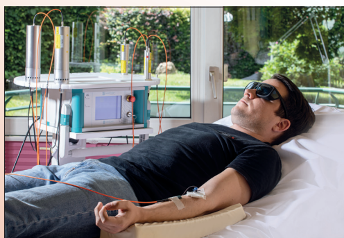
Patient bei der Laseriv-Behandlung