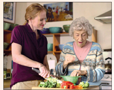
Die Versorgung mit wichtigen Nährstoffen ist in der älteren Bevölkerung in großen Teilen nicht ausreichend.

Nahrungsergänzungsmittel könnten zudem ergänzend helfen, Versorgungslücken zu schließen: „Nahrungsergänzungsmittel können im