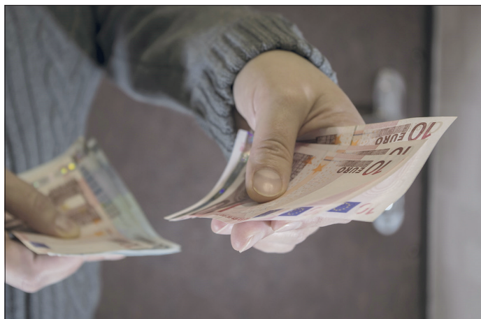
Im Chat werden am nächsten Mittwoch Fragen zur Finanzierung eines Studiums beantwortet.

zierung es gibt, klärt der nächste abi>> Chat am kommenden Mittwoch, 16. Juni. Von 16 bis 17.30 Uhr erhalten die Teilnehmenden Antworten auf Fragen wie: Welcher Nebenjob lohnt sich? Welche rechtlichen Rahmenbedingungen gelten? Wie funktioniert BAföG?