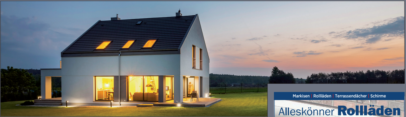
Moderne Alarmanlagen schränken die Bewegungsfreiheit in keiner Weise ein, weder für Mensch noch Tier. Selbst Fenster können bei Anwesenheit gekippt sein.

Wenn wir unser Zuhause absichern möchten, denken wir als Erstes über die Anschaffung einer Alarmanlage nach. Manchmal besteht jedoch die Sorge vor Fehlalarmen und einer komplizierten Bedienung. Eine einfache und sichere Lösung bringen die Alarmanlagen eines Spezialisten mit sich, indem sie Luftdruck