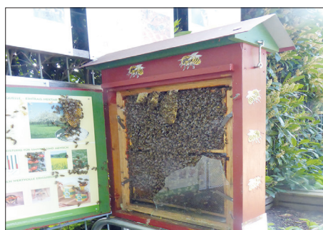
Warum tut jemand so etwas? In hirnloser Zerstörungswut wurde die Glasscheibe am Bienenstock an der Holstein Therme Bad Schwartau eingeschlagen.