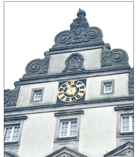
Die Uhr am ehemaligen Amtsgericht befindet sich im Originalzustand. Sie läuft seit 112 Jahren und funktioniert mechanisch.

Thomas Braun ist von der Funktionsfähigkeit des alten Uhrwerks begeistert: „Heute sind solche mechanischen Turmuhrwerke nur noch selten in Betrieb. Dies liegt vor allem an der aufwändigen Wartung und Pflege. Viele dieser alten Uhren wurden umgebaut und funktionieren heute elektronisch oder durch Funk. Da sich unsere Uhr noch im Originalzustand befindet, ist sie etwas ganz Besonderes und ich freue mich, dafür verantwortlich sein zu dürfen.“