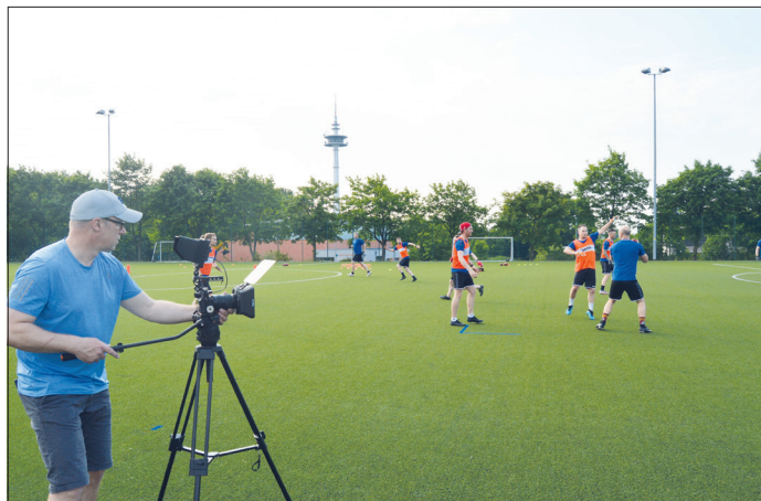
Alle Abteilungen des ATSV Stockelsdorf werden in dem Film, der ab heute auf YouTube läuft, vorgestellt. Hier zeigen die Jungs der Flag Football-Abteilung ihr Können vor laufender Kamera.