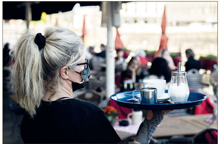
Allein mit den Gästen: So wie diese Servicekraft kommen viele Beschäftigte im Gastgewerbe mit der Arbeit kaum hinterher – weil während der Pandemie ein großer Teil des Personals die Branche verlassen hat.

„Schon vor Corona waren die Arbeitsbedingungen im Gastgewerbe alles andere als rosig. Die Betriebe haben es versäumt, die