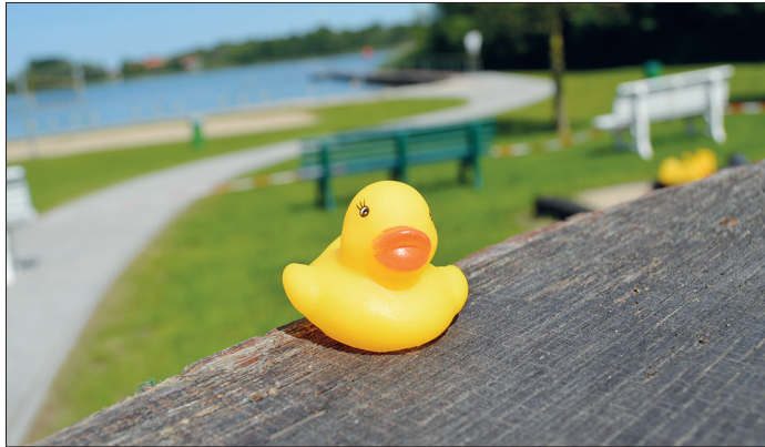
Um die maximale Personenanzahl auf dem Gelände der Badeanstalt nicht zu überschreiten, kommen auch dieses Jahr die beliebten Enten in abgezählter Stückzahl wieder zum Einsatz.

Die Badeanstalt in Offendorf ist bis zum 15. September täglich je nach Wetterlage von 10 bis 19 Uhr geöffnet. Die Preise sind stabil geblieben: Kinder zahlen 1 Euro, Erwachsene 2 Euro Eintritt.