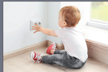
Steckdosen sind für Kleinkinder stete Gefahr.

nur dann, wenn beide Pins (=Steckerkontakte) gleichzeitig eingeführt werden. Für ein Kind, das ein Kabel oder andere stromleitende Gegenstände in die Steckdose einführt und dabei nur Druck auf eine Öffnung ausübt, besteht so keine Gefahr. Auch Steckdosen-Schutzkappen zum Aufstecken sind geeignet. Sie verschließen die Steckdose komplett, so dass sie erst wieder benutzt werden kann, wenn die Kappe entfernt wurde.