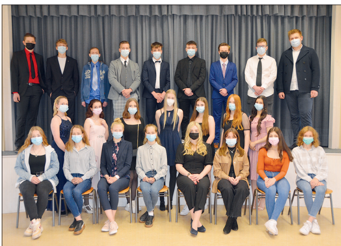
... und der 10b wurden weitere Schüler aus insgesamt sechs Klassen verabschiedet.

„Es waren sehr individuelle und rundum gelungene Feiern“, so die Organisatoren, die einen besonderen Dank an alle richteten, „die engagiert dazu beigetragen haben, dass die Abschlussfeiern in diesem würdigen Rahmen stattfinden konnten“ und den nunmehr ehemaligen Schülern alles Gute und viel Erfolg auf ihrem weiteren Lebensweg wünschten.