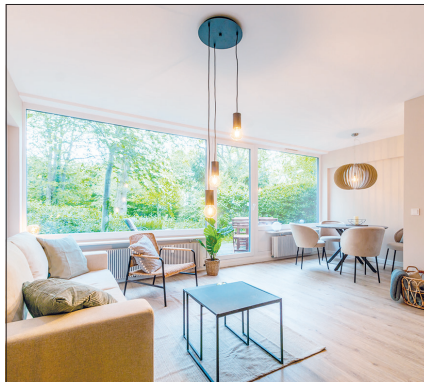
Diese schöne, renovierte und modern gestaltete Eigentumswohnung in Sierksdorf bietet Möllerherm Immobilien zum Kauf an.