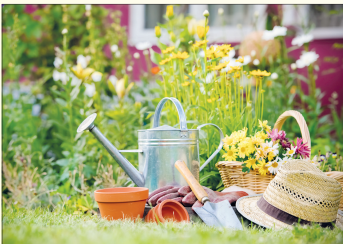
Zum Beginn der Gartensaison sollten sich die Hobbygärtner unbedingt vor dem Bepflanzen der heimischen Blumenbeete aber auch beim Kauf von Zimmerpflanzen darüber informieren, welche Pflanzen giftig sind und somit Gesundheitsgefahren bergen.