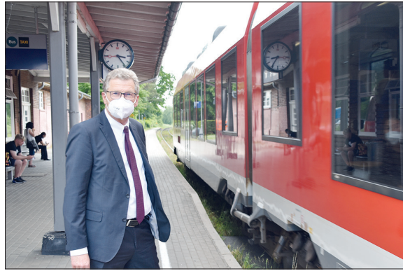
Schleswig-Holsteins Verkehrsminister Bernd Buchholz besuchte den Bahnhof in Timmendorfer Strand und kündete die Taktverdichtung für die Sommerwochenenden an.

Dank der Umsteige-Möglichkeit in Lübeck besteht in dieser Zeit auch für den Kreis Stormarn aus Bad Oldesloe und Reinfeld eine halbstündliche Verbindung an die Lübecker Bucht. Von Hamburg aus gilt dieses Angebot ab dem 17. Juli mit dem Ende der Bauarbeiten vor Ahrensburg. „Das Land bietet Gästen wie Einheimischen damit ein zusätzliches, attraktives Angebot an Sitzplätzen, um bei steigendem Reiseverkehr in den Sommermonaten eine gute Verteilung der Fahrgäste in den Zügen zu ermöglichen“, so der Minister. Statt der bisherigen 250 Sitzplätze stünden an den Wochenenden mit dem zusätzlichen Angebot rund 375 Sitzplätze stündlich zur Verfügung.