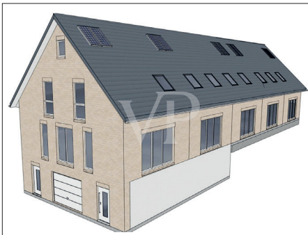
Das Neubauprojekt entsteht in Techau auf einem Eigenlandgrundstück in ländlicher Umgebung.

Für weitere Fragen steht der Shop Bad Schwartau telefonisch unter 0451/88183220 oder per Mail unter bad.schwartau@von-poll.com zur Verfügung.