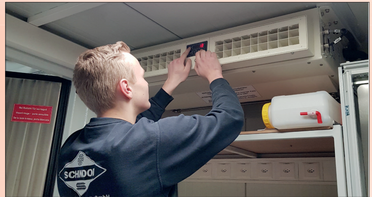
Seit über fünf Jahrzehnten ist die Firma Schnoor führend in Sachen Kühltechnik. Hier wartet ein Mitarbeiter eine Klimaanlage.