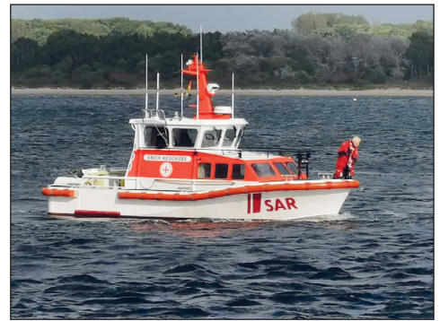
Zahlreiche Rettungsboote und Helfer suchten am Samstagabend nach dem vermissten Mädchen.

Die Staatsanwaltschaft Lübeck und das Kommissariat 11 der Bezirkskriminalinspektion Lübeck haben die Ermittlungen zum Ablauf des Un-