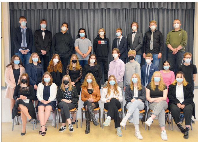
So, wie die Schüler der 10 a ...