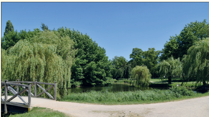
Der alte Kurpark an der Bergstraße in Timmendorfer Strand soll schrittweise aufgeforstet werden.

Kurpark an der Bergstraße ist leider ziemlich dezimiert. Um die klimawandelbedingten Extremwetterlagen künftig besser abmildern zu können, müssen Baumbestände gestärkt und die Böden verbessert werden! Auf der 4,7 ha großen Grünfläche sollen unter anderem 50 Bäume und Sträucher nachgepflanzt werden – da geht ja eventuell noch etwas mehr, um die Wohn- und Erlebnisqualität zu verbessern. Dafür wünsche ich gute Entscheidungen!“