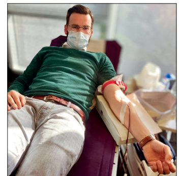
Die Patientenversorgung mit Blutpräparaten muss auch in den Herbstferien sichergestellt werden, deswegen bietet das DRK in Travemünde einen Blutspende-Termin an.

Eine Blutspende ist auch nach einer Gripeschutzimpfung am Tag nach der Impfung möglich, sofern sich der oder die Geimpfte gesund fühlt.