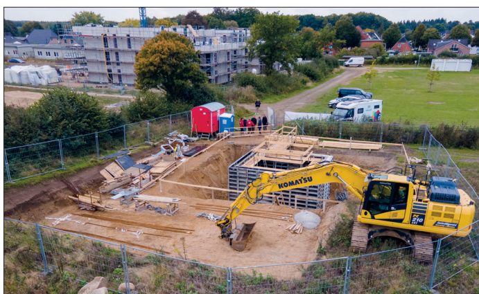
Auf diesem Areal neben dem Neubaugebiet entsteht das Wärmenetz.