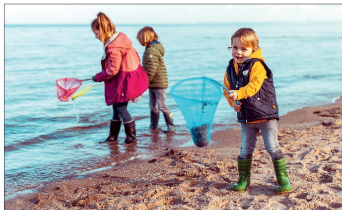
Heute ein Strandentdecker, morgen ein Fischbrötchendetektiv und übermorgen ein Naturforscher ....