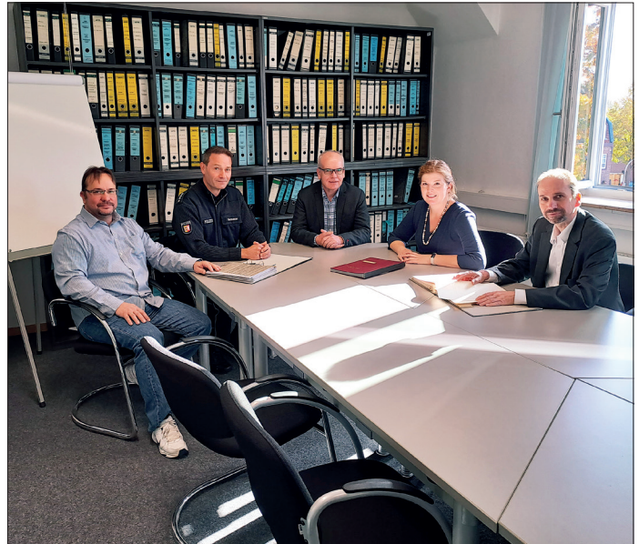
Regelmäßig kommt ein „Runder Tisch“ um Bürgermeisterin Julia Samtleben in Stockelsdorf zusammen, um über Maßnahmen bei Gasmangel oder Stromausfall zu sprechen.

Dabei gibt es einige Basics, die jeder beachten kann. In jedem Haushalt sollten funktionierende Taschenlampen, Kerzen und Streichhölzer an einem zentralen Ort verwahrt werden, damit man diese immer auffinden kann. Die meisten Stromausfälle sind nachts. Außerdem sollte man nach Möglichkeit immer einen gewissen Frischwasservorrat (zum Beispiel in Form von Mineralwasser) und haltbare Lebensmittel für ein paar Tage vorhalten. Es macht Sinn, ein batteriebetriebenes Radio anzuschaffen oder im Zweifel für Warnmeldungen an das Autoradio als mögliche Informationsquelle zu denken. Im Falle eines Stromausfalls können die Festnetztelefone nicht mehr betrieben werden, weil diese heutzutage an die Stromversorgung angeschlossen sind. Außerdem brechen in der Regel nach kurzer Zeit die Mobilfunknetze zusammen. Deswegen versuchen Sie gerade im Falle eines Stromausfalls jedes unnötige Telefonat zu vermeiden, damit Notrufe möglichst lange durchgestellt werden können. Der Ausfall ist kein Grund zur Panik. Im Ernstfall, das heißt bei einem Stromausfall mit einer längeren Dauer (länger als 30 Minuten erwartete Ausfallzeit), sind die Ortswehren der Gemeinde Stockelsdorf dazu angehalten, umgehend die Feuerwehreinrichtungen zu besetzen, damit im Notfall von