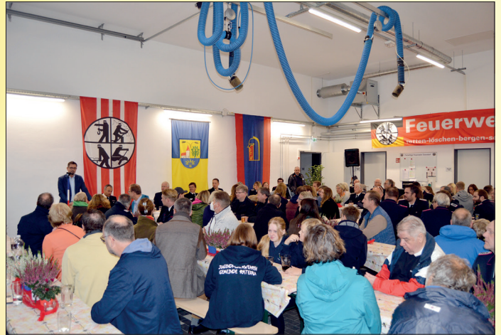
Rund 150 Gäste hatten sich zur Einweihung des neuen Feuerwehrhauses in Ovendorf eingefunden.

Großen Dank sprach er der Gemeinde Ratekau für die Unterstützung ihrer acht Ortswehren und allen aus, die sich in der Freiwilligen Feuerwehr engagierten und viel Zeit investierten – insbesondere den