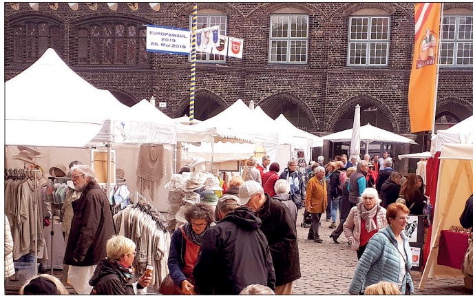
Am kommenden Wochenende findet wieder der beliebte Kunst- und Handwerkermarkt „Handgemacht“ in Lübeck statt.

Es gibt Unikatgeschmuck von Schmuckdesignern aus den verschiedensten Materialien, zum Beispiel Silber, Horn, Mineralien, Keramik, Edelstein, Bernstein und Holz. Mit dabei sind vielfältigste Textildesign aus Leinen, Walk, Strick, Hüte und Mützen, Taschen aus Stoff und edlem Leder, Papier- und Buchbindarbeiten, Briefpapiere und Karten, maritime Fotografien, Bilder und Grafiken, Glasbläserkunst, Edeldahllobjekte, Schmiede- und Töpferarbeiten für den Hausgebrauch und für den Garten, schöne gedrechselte Dinge aus Holz und viele andere de-