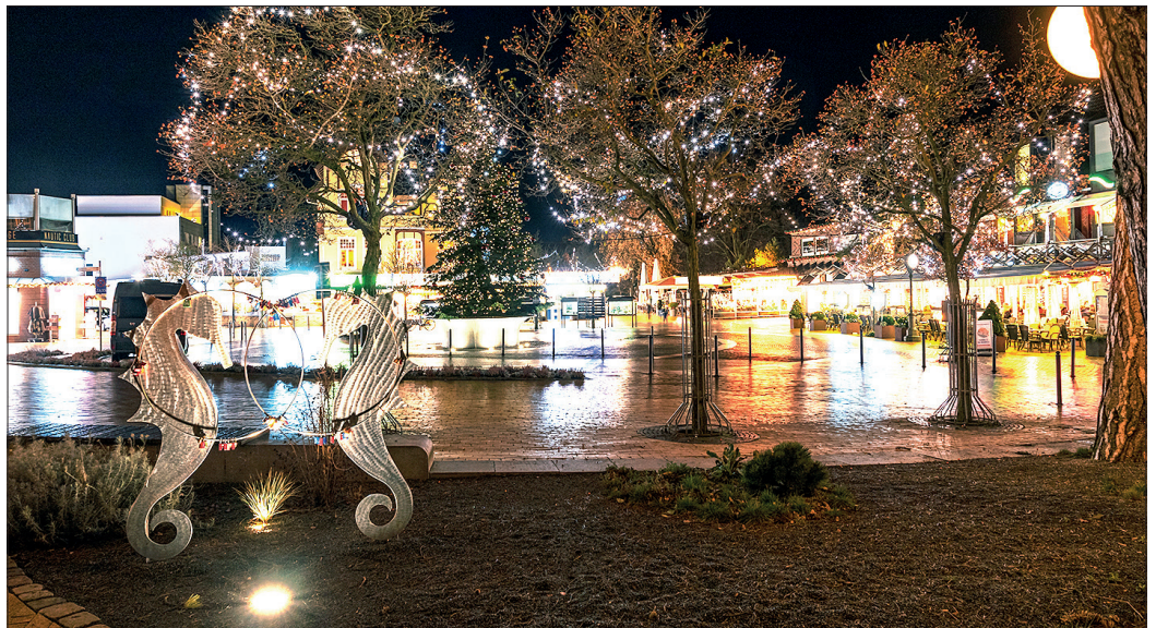
Auch in diesem Winter soll das Timmendorfer Zentrum im Lichterglanz strahlen.

Tdf. Strand. Die Weihnachtsbeleuchtung in Timmendorfer Strand gehört seit vielen Jahren zu den ganz besonderen Attraktionen in der dunklen Jahreszeit. Rund 120 Bäume werden auch diesmal wieder mit 150.000 Lichtern geschmückt. Und das ist keine leichte Aufgabe für die Aktivgruppe für Handel und Gewerbe Timmendorfer Strand (AGHGT), die für diese Aktion verantwortlich ist. „Es wäre sehr schön, wenn wir auch in diesem Winter in der dunklen Jahreszeit Timmendorfer Strand durch die Lichterketten zum Strahlen und Erleuchten bringen und den Bürgerinnen, Bürgern und Gästen so in der Vorweihnachtszeit, weihnachtliche Stimmung verbreiten können,“ so der Vorsitzende der AGHT, Heinz Meyer. Zum Thema Energie sparen erklärte er: „Da wir als Aktivgruppe bereits vor Jahren die Lichterketten voll auf LED umgerüstet haben und zusätzlich in diesem Jahr nur in der Zeit vom 16 bis 22 Uhr die Lichterketten einschalten, werden mehr als 40 Prozent an Energiekosten eingespart.“ Meyer weiter: „In den vergangenen Jahren haben wir immer wieder unter den Mitgliedern der Aktivgruppe Baumpaten für den Lichterschmuck gesucht, aber die Finanzierung der Weihnachtsbeleuchtung