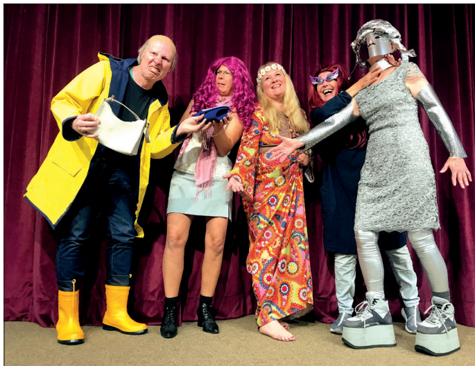
Seit über 40 Jahren gibt es den Theater-Kurs „bühne 15“ an der Vhs Bad Schwartau. Gewohnt turbulent geht es bei den Stücken zu. Bei „Wer sieht denn sowas?“ ist das nicht anders.

Während Ottokar die technischen Sendungen wie „Klo und Spülung“