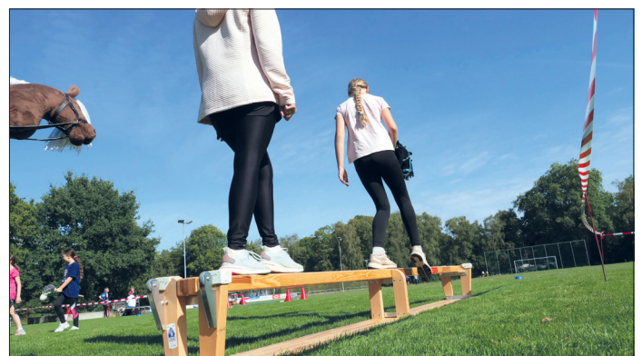
... des ATSV Stockelsdorf etwas zu bieten.