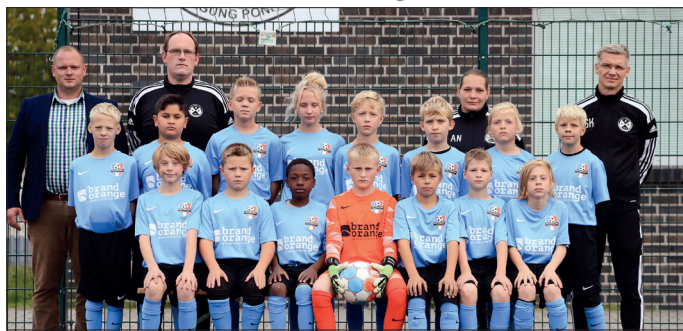
Die D3-Jugend aus Pönitz (SG Küstenkicker) bedankt sich für die Trikotspende.