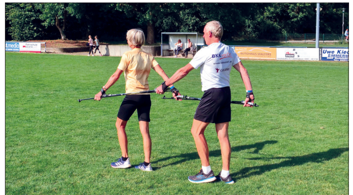
Für alle Generationen hatte der 1. Aktivtag...

Dennoch kamen sie zu einer einstimmigen Wertung: „Wer nicht dabei war, hat mit Sicherheit einen tollen Tag verpasst.“