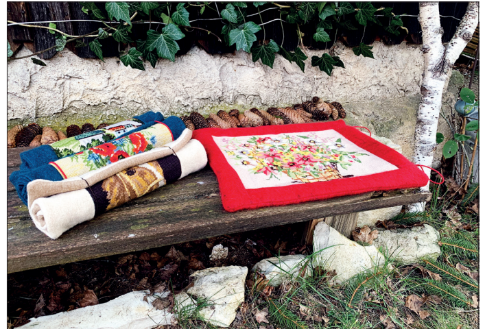
Praktisch für draußen: Ein Bankwärmer, der von Traudl Schauer-Neukum handgefertigt wurde.

berg (Scharbeutz) in der Seestraße 56/ Ecke Uhlenflucht. Von 11 bis 17 Uhr freut sich Traudl Schauer-Neukum auf viele Besucherinnen und Besucher.