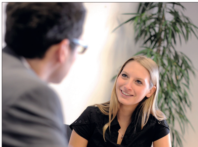
Die Berufsberatung hilft dabei, den passenden Beruf zu finden.