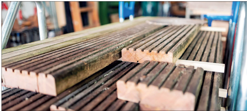
Beim Seebrückenholzaktionstag in Scharbeutz am 22. Oktober gibt es maritime Erinnerungen am laufenden Meter.

Am Aktionstag, am Samstag, dem 22. Oktober, gibt es in der Zeit von 14 bis 17 Uhr die Möglichkeit, sich gegen eine Spende die persönlichen Lieblingsstücke zu sichern. Die Spendeneinnahmen kommen zu 100% dem DLRG Ortsgruppe Haffkrug-Scharbeutz e.V. zugute, auf dessen Gelände im Fuchsberg 1 in Scharbeutz der Aktionstag stattfindet.