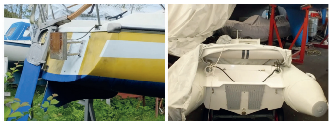
Küstenboot Habicht des Wasserschutzpolizeireviere Lübeck sowie ein Segel- und Schlauchboot - Tatobjekte nach vorangegangenen Diebstahl der Außenbordmotoren.