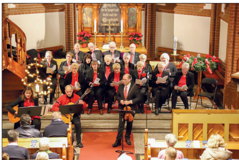
Am Samstag findet das beliebte Adventssingen in der Stockelsdorfer Kirche statt.

und beliebte Advents- und Weihnachtslieder unter der Leitung von Michael P. Schulz. Der Eintritt ist frei, gern wird jedoch eine Kollekte für die Chor- und Kirchenmusik entgegengenommen. Liederhefte werden kostenlos ausgegeben.