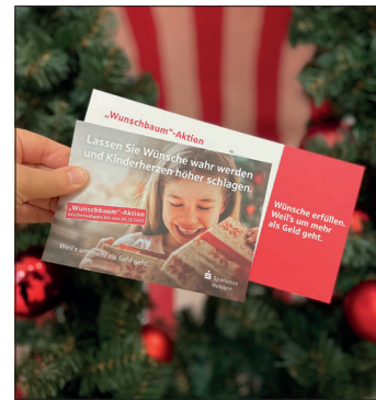
Die Sparkasse Holstein führt bis zum 16. Dezember in ihren Filialen eine Wunschbaumaktion durch.

wunsch bis zu einem Betrag von 15 Euro auf eine Karte schreiben und diese in der jeweiligen Filiale abgeben. Die Karten werden dort anonymisiert an den Weihnachtsbaum gehängt. Besucherinnen und Besucher der Filiale können einen Wunsch – oder gern auch mehrere – mitnehmen. Der letzte Schritt „auf dem Weg zu leuchtenden Kinderaugen“: Die hoffentlich zahlreichen Wunschfüller bringen die Geschenke bis spätestens 16. Dezember in ihre örtliche Filiale. Die Übergabe an die Kinder erfolgt anschließend durch das Sparkassen-Filialteam vor Ort.