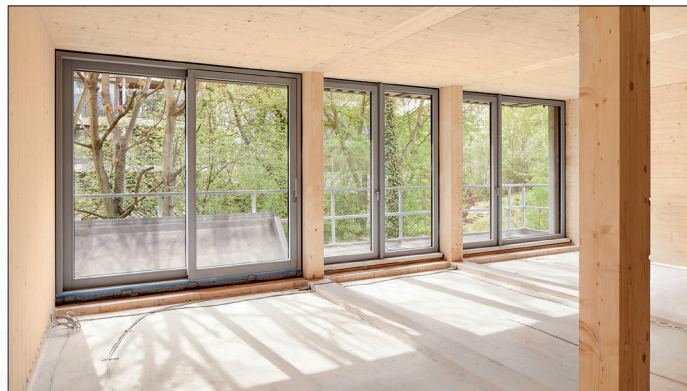
Fensterrahmen aus einem Aluminium-Holz-Verbund bieten viele Gestaltungsmöglichkeiten.

Aluminium-Fenster zeichnen sich durch beste Recyclingfähigkeit aus.