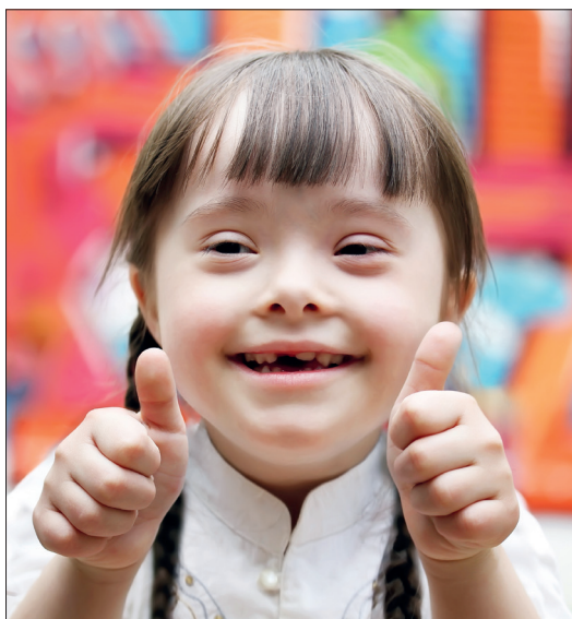
Man ist nie zu klein, um großartig zu sein.

Von der Frühförderung oder der Kindertagesstätte über Freizeitangebote bis hin zu Wohngruppen oder der Jugendsozialarbeit: Die Vorwerker Diakonie bietet Kindern und Jugendlichen und ihren Familien die Hilfe, die benötigt wird. Jedes Kind wird in seiner Individualität wahrgenommen und