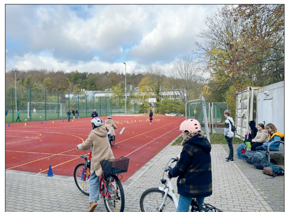
Vor Kurzem fand ein Verkehrssicherheitstag am OGT statt, unter anderem mit einem Fahrradparcours.

Dieser für alle Beteiligten lehrreiche Tag soll unbedingt im nächsten Schuljahr wiederholt werden.