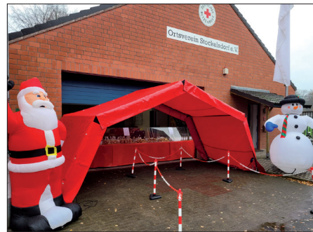
An seiner Unterkunft im Bäckergang lädt das DRK Stockelsdorf am Samstag zu einem adventlichen Verkauf ein.

Stockelsdorf. Das Stockelsdorfer DRK lädt am Samstag, dem 26. November, von 11 bis 16 Uhr wieder zu einem adventlichen Verkauf an der DRK-Unterkunft im Bäckergang 8 neben der ATSV-Sporthalle ein. Es gibt selbstgebackene Kekse, selbstgebackenen Stollen und Erbsensuppe aus der DRK-eigenen Feldküche im Glas abgefüllt. Dieses Jahr können Erbsensuppe und Bockwurst auch wieder vor Ort verzehrt werden. Außerdem backt das DRK-Team Mutzen und schenkt Kaffee und Punsch aus. „Wir freuen uns sehr, dass wir dieses Jahr vor Ort mehr anbieten können und die Besucher unseres adventlichen Verkaufs auch wieder vor Ort