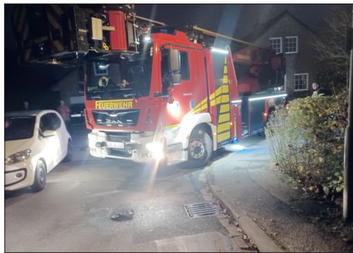
Kein Durchkommen: Der in der Kurve abgestellte Pkw macht es der Drehleiter unmöglich, in die Holbeinstraße einzubiegen.

engen Kurve abgestellt war, dass ein für den Besichtigungstermin mitgeführtes Feuerwehrfahrzeug keine Möglichkeit gab, in die Hohlbeinstraße einzubiegen, erklärte sie weiter. „Uns geht es jetzt darum, zu informieren. Wir werden dazu zunächst einmal mit entsprechenden Zetteln an derart schlecht geparkten Fahrzeugen auf die Situation aufmerksam machen und dann vielleicht auch Knöllchen verteilen“, sagte sie und deutete auf den in der Kurve geparkten Pkw: „In die-