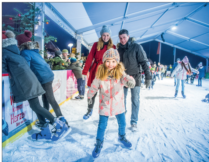
Beim Schlittschuhtreff Scharbeutz im strandnahen Kurpark kann man fleißig Schlittschuhrunden drehen und auch Eisstöcke schieben.

Bei den eintrittsfreien Erlebnisangeboten des Schlittschuhtreff Scharbeutz haben Kinder und Jugendliche aus der Gemeinde Scharbeutz einen kleinen Heimvorteil, denn für sie