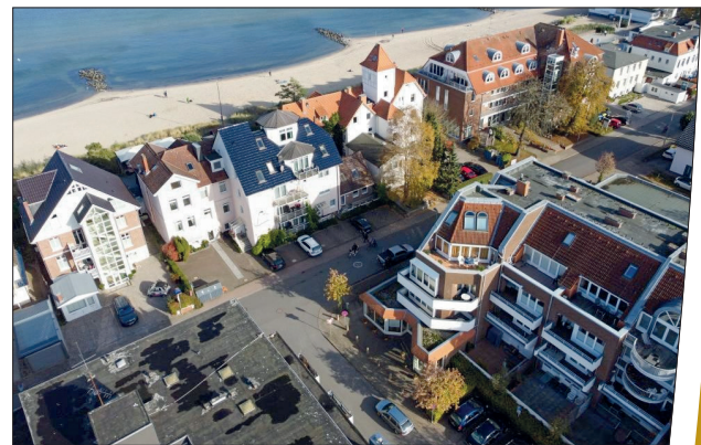
In dieser Wohnanlage in direkter Strandlage (unten rechts im Bild) befindet sich die von Loose Immobilien zum Kauf angebotene Zwei-Zimmer-Wohnung.