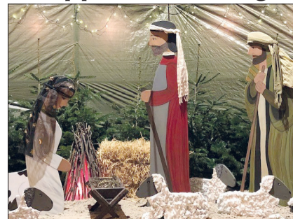
Am kommenden Freitag wird die Krippe im Pavillon auf dem Seebückenvorplatz in Haffkrug eröffnet.