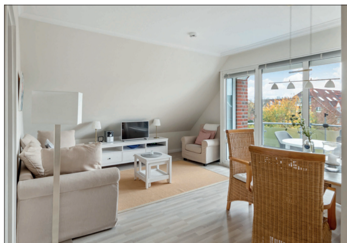
Diese schöne möblierte Wohnung bietet Dahler & Company Immobilien zum Kauf an.

Poststraße 12 | 23669 Timmendorfer Strand | Tel. 04503.83 12 timmendorferstrand@dahler.com