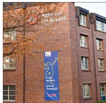
Die Agentur für Arbeit Lübeck beteiligt sich auch in diesem Jahr an der Aktion und setzt ein Zeichen gegen Gewalt an Frauen.

Hilfe bieten auch Beratungsstellen wie zum Beispiel der Frauennotruf Ostholstein, arant und biff. Diese haben neben der persönlichen Beratung, auch die sichere und anonyme Online-Beratung „text us“ als weitere Kontaktmöglichkeit in ihr Portfolio aufgenommen. Die Beratungsstelle bei digitaler Gewalt ist www.hateaid.org .