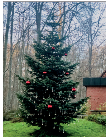
Der Weihnachtsbaum vor der Waldkirche begrüßt die Timmendorfer Wahlberechtigten zur Kirchenwahl.