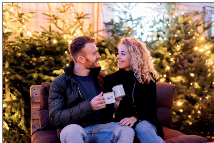
In verschiedenen Locations der Lübecker Bucht laden gemütliche Wintertreffs zum Verweilen ein.