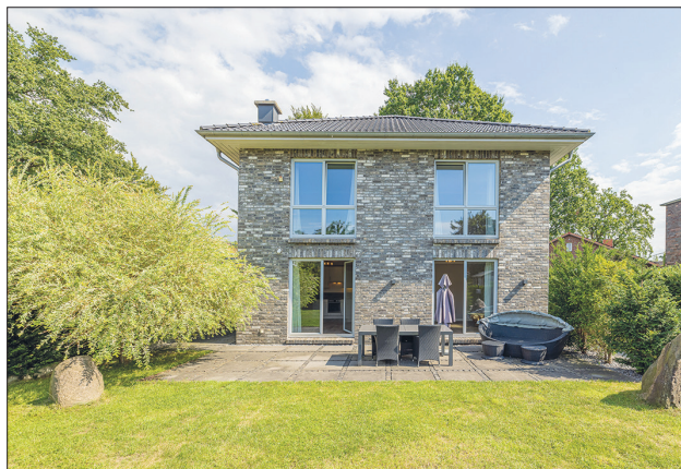
Die traumhaft schöne Stadtvilla liegt in idyllischer Lage in der Gemeinde Ratekau.