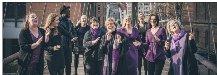
Ein Konzert mit dem Gospelchor „ForYourSoul“ in der Adventszeit hat in Sereetz schon Tradition.