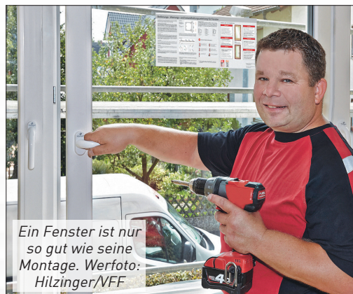
Ein Fenster ist nur so gut wie seine Montage.

Wer sichergehen will, wählt einen Fensterfachbetrieb mit den