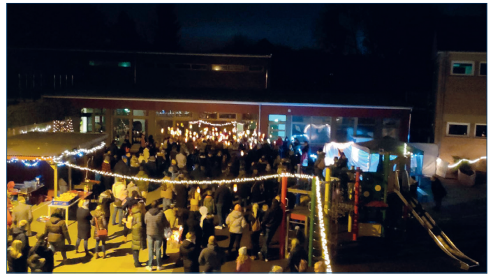
Vor dem Umzug trafen sich alle Teilnehmer auf dem mit zahlreichen Lichterketten geschmückten Schulhof.