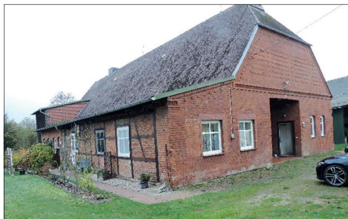
Das romantische Bauernhaus liegt direkt am Ufer des Menzendorfer Sees.

Kontakt zu Erika Zech Immobilien e.K. unter Telefon 0451/393037, E-Mail: info@erika-zech-immobilien.de. Weitere Infos: www.erika-zech-immobilien.de.