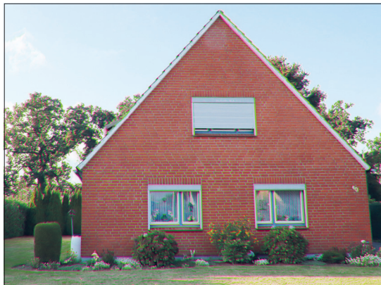
Der gepflegte Altbau bietet sowohl Innen als auch im Außenbereich viel Spielraum, eigene Ideen zu verwirklichen.

Verhandlungsbasis beim Kaufpreis sind 365.000 Euro. Nach Abschluss des Kaufvertrages zahlt der Käufer dem Makler eine Courtage in Höhe von 3 Prozent inklusive gesetzlicher Mehrwertsteuer des beurkundeten Kaufpreises. Einzelbesichtigungen sind möglich, Bezug nach Absprache. Die Ansprechpartner im Immobilienbüro in Techau sind unter den Rufnummern 04504/707268 oder 0171/801775 erreichbar.