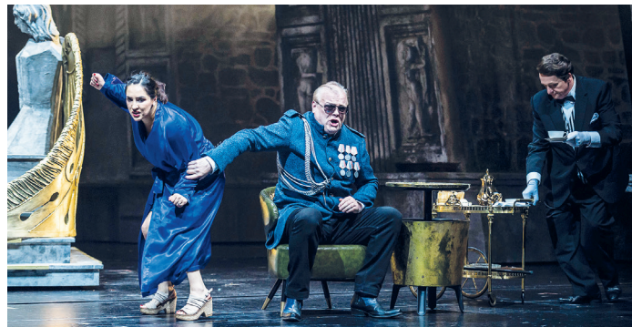
„Die Liebe der drei Könige“: Drei Könige, eine Frau. Jeder von ihnen möchte ihr König sein – sie will dagegen ihre Zukunft selbst bestimmen.