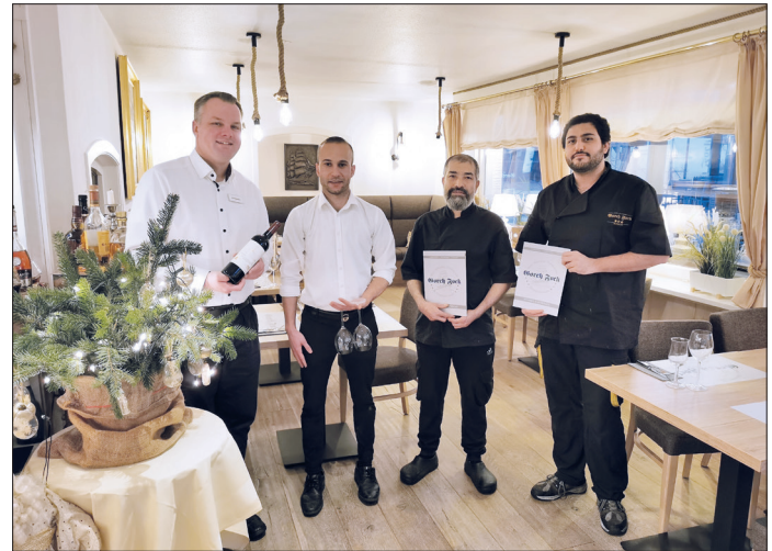
Das Service- und Küchenteam vom Hotel Gorch Fock verwöhnt seine Restaurantgäste zu den Feiertagen - ob à la carte oder mit festlichen Menüs zu Weihnachten und Silvester.