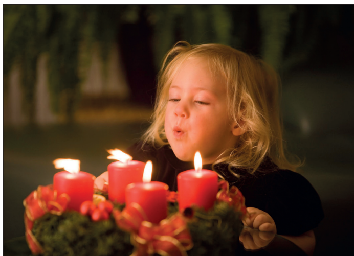
In der Adventszeit steigt die Gefahr, sich zu verbrennen. Jedes Jahr müssen auch Kinder im Kreis Ostholstein mit Verbrennungen ärztlich versorgt werden.

Gewebe zusätzlich schädigen. Die meisten Unfälle mit kleinen Kindern können verhindert werden, wenn bestimmte Vorsichtsmaßnahmen ergriffen werden. Dazu gehört Streichhölzer und Feuerzeuge immer konsequent wegzuschließen, statt echter Kerzen in der Adventszeit LED-Kerzen zu verwenden, Adventskränze nie unbeaufsichtigt zu lassen und Tassen oder Kannen mit heißen Getränken immer weit entfernt vom Tischrand zu stellen. Weitere Informationen zur Kindersicherheit bei der „Bundesarbeitsgemeinschaft (BAG) Mehr Sicherheit für Kinder e.V.“ unter www.kindersicherheit.de .