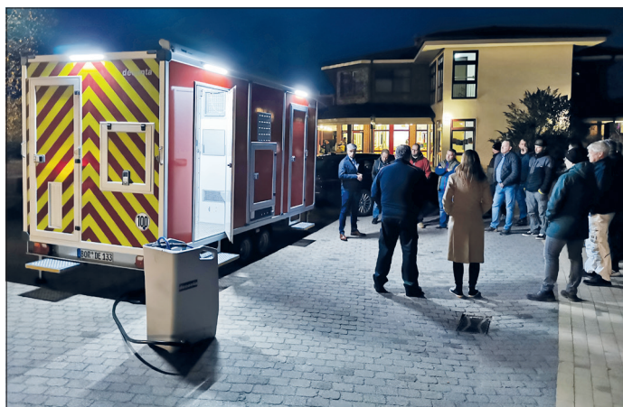
deconta-Bereichsleiter Klaus Albert stellte im November den Feuerwehr-Hygieneanhänger interessierten Ausschussmitgliedern, Feuerwehrvertretern und Ordnungsamtsmitarbeitern vor.

In der Sitzung der Gemeindevertretung, die am morgigen Donnerstag, dem 15. Dezember, um 18 Uhr im Hotel Country Inn in Timmendorfer Strand zusammenkommt, soll der Haushalt 2023 beschlossen werden.