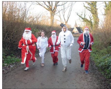
Beim Nostalgie-Lauf gehen einige Sportler in weihnacht-winterlichem Outfit an den Start.

Warum findet der Nostalgie-Lauf am 18. Dezember statt, der doch eigentlich immer am letzten Sonntag im Jahr über die Bühne geht? Da 2022 mit einem Sonnabend endet, wäre 25. Dezember an der Reihe. Ein Lauf