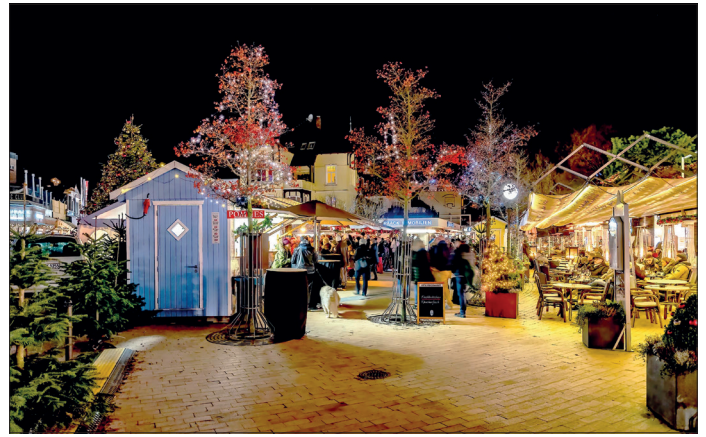
Vom 15. Dezember bis zum 1. Januar findet wieder der „Musikalische Weihnachtsmarkt“ auf dem Timmendorfer Platz statt.