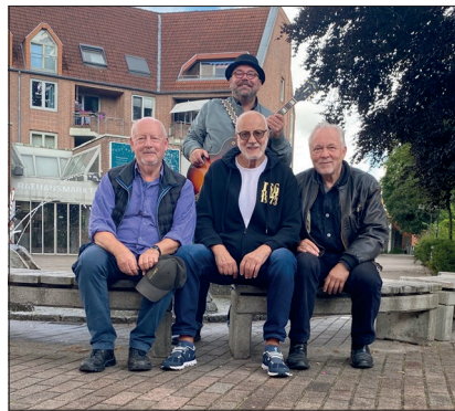
Am Mittwoch, dem 21. Dezember, tritt die Timmendorfer Skiffle Group beim Weihnachtsmarkt auf.

Dieses Fest hat Tradition und erfreut sich mit jedem weiteren Jahr einer stetig wachsenden Fan-Gemeinde. Diesmal geht der Weihnachtsmarkt vom 15. Dezember bis 1. Januar 2023. Dann heißt es wieder: „Musik liegt in der Luft“. Täglich ab 12 Uhr lädt die Aktivgruppe Timmendorfer Strand zum Verweilen ein. Der Weihnachtsmann kommt jeden Tag zwischen 15 und 16 Uhr und erfreut die kleinen und großen Herzen. Kinderkarussell, süße Stände und der kleine Bärenwald erfreuen die Kinder zusätzlich.