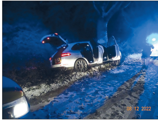
Die Polizei fand den von den Fahrzeuginsassen verlassenen Porsche Cayenne an einem Baum im Kattenhöhlener Weg.

Vom Fahrzeug aus fand sich eine Schuheindrucksspur im frischen Schnee. Diese führte direkt zu dem Haus, in das die junge Scharbeutzerin zuvor gegangen war. Mit Unterstützung eines weiteren