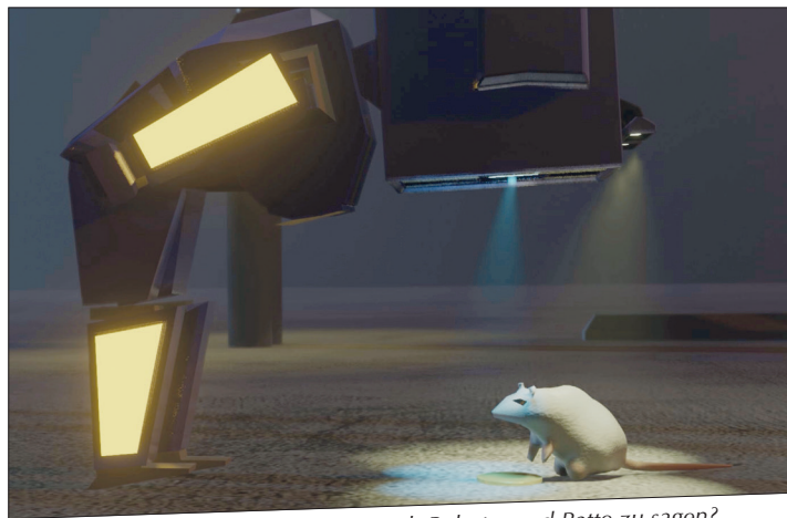
„Bots and Rats“ – was haben sich Roboter und Ratte zu sagen?

Donnerstag, 15. Dezember, im Moviestar, Eutiner Ring, Bad Schwartau. Eintritt 7 Euro, für Koki-Mitglieder 4,50 Euro. Vorstellungsbeginn ist um 20.15 Uhr.