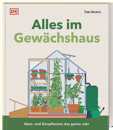
Nutz- und Zierpflanzen das ganze Jahr

Es ist der Traum vieler: Ein eigenes Gewächshaus, in dem man besondere Sorten Obst und Gemüse in Bio-Qualität und maximaler Frische selbst anbauen und genießen kann. Doch der Weg dorthin wirft viele Fragen auf: Was muss man beim Kauf und Aufbau beachten? Welches Modell passt zu den eigenen Ansprüchen und der Grundstückgröße? Der umfangreiche Ratgeber „Alles im Gewächshaus“, nimmt die Leser bei all diesen Fragen an die Hand und führt sie mit ausführlichen Informationen und allerhand praktischen Tipps durch die Ratlosigkeit, der sich viele Gartenbesitzer zu Beginn gegenübersehen. 240 Seiten vollgepackt mit Wissen für jede Gewächshausituation erleichtern den Start und schaffen einen Überblick über Aufgaben im Jahresverlauf. ISBN: 978-3-8310-5204-2