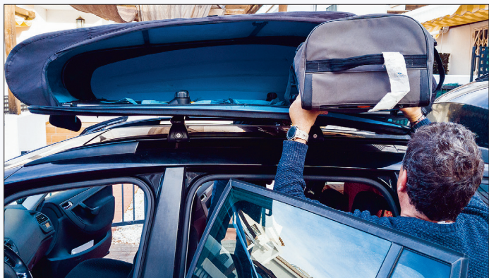
Die Dachbox aufs Auto und ab in den Urlaub: Dabei kommt es immer wieder zu schweren Unfällen.

Bedienungsanleitung des Autos und liegt meist zwischen 50 bis 100 Kilogramm. „Wichtig ist, das Eigengewicht der Box und des Lastenträgers mit einzurechnen“, erklärt der Fachmann.