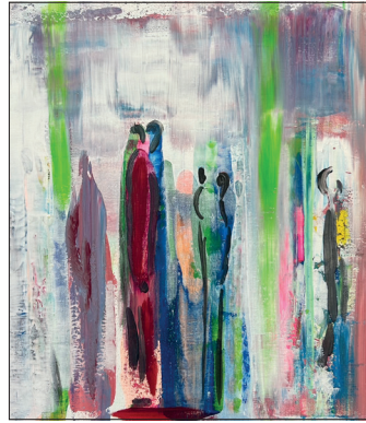
Ein Kunstwerk von Janina Krellenberg.

Die Ausstellung bietet Kunstinteressierten die Gelegenheit, mit den Künstlerinnen ins Gespräch zu kommen und die Vielfalt moderner abstrakter Acrylkunst in besonderer Atmosphäre zu entdecken. Weitere Informationen im Internet unter www.kleinewaldschaenke.de .