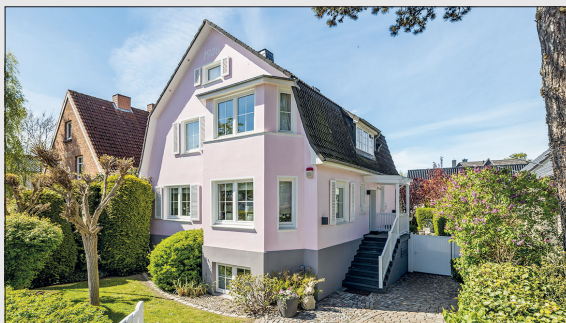
Diese Bädervilla in Niendorf/Ostsee bietet Dahler Immobilien aktuell zum Kauf an.

2. Obergeschoss stehen zwei weitere individuell nutzbare Zimmer bereit. Das Souterrain beherbergt zwei Zimmer, eine Küche und ein Duschbad sowie einen eigenen Eingang – ideal als Einliegerwohnung oder Gästebereich. Die Immobilie eignet sich hervorragend als repräsentatives, bezugsfertiges Zuhause oder als Zweitwohnsitz in Timmendorfer Strand, mit großzügigem Wohnen, gepflegter Substanz sowie einer gelungenen Kombination aus Tradition und Moderne. Nur wenige Schritte zum Strand, fußläufig zum Ortszentrum und Niendorfer Hafen, mit hervorragender Infrastruktur, Einkauf, Ärzten, Apotheken, Schulen sowie guter Verkehrsanbindung. Nähe zur Lübecker Bucht und vielfältige Freizeitangebote wie Golf, Segeln und Wassersport. Bezug kurzfristig möglich. Für weitere Informationen oder eine Besichtigung rufen Sie uns gern an.