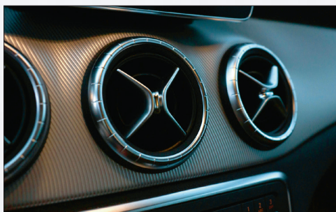
Ein gut temperierter Fahrzeuginnenraum dient auch der Sicherheit.

chend viele Bestandteile umfasst ein sorgfältiger Check. Er reicht von der Sichtprüfung aller Schläuche, Leitungen und des Kompressors über Funktions-, Kühlleistungs- und Dichtheitstests bis zur Prüfung und Ergänzung des Kältemittels sowie der Reinigung und Desinfektion von Verdampfer und Luftkanälen. Bei der Gelegenheit wird auch der Innenraumfilter (manchmal Pollenfilter genannt) kontrolliert und bei Bedarf ersetzt. Eine jährliche Prüfung ist grundsätzlich sinnvoll. Denn Klimaanlagen können zum Beispiel unmerklich Kältemittel verlieren, ohne dass der Fahrer dies sofort merkt. Wenn die Füllmenge stark sinkt, arbeitet der Kompressor immer härter, verschleißt schneller und kann überhitzen.