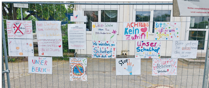
Schüler der 5. Klasse haben am Bauzaun verschiedene Bilder aufgehängt, um ihr Anliegen zu verdeutlichen.

Liebe Schulhof-Überquerer, Hier beginnt der Schulhof der GGS-Strand-Europaschule. Es bewegen sich viele Kinder und Jugendliche von montags bis freitags im Zeitraum von 7 - 16 Uhr auf dem Gelände. Es ist ein geschützter und sensibler Bereich. Unsere Schülerinnen und Schüler und auch alle an Schule Beteiligte wünschen sich, dass der Schulhof tagsüber nicht mehr als offizielles Weg über als Abkürzung zu den Arztpraxen genutzt wird. Es kann in der Vergangenheit zu vielen „schwierigen“ Situationen mit Schulhof-Überquerern, die unsere Schülerinnen und Schüler missbraucht haben. Bitte beachten Sie auch, dass Hunde nicht gestattet sind. Viele Kinder fürchten sich vor Hunden. Lecker finden wir regelmäßig respektlos auf den Schulhof. Bitte respektieren Sie unseren Wunsch und nehmen Sie Rücksicht! Danke!