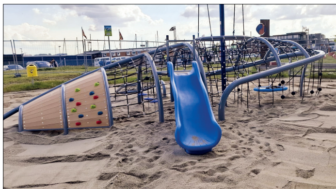
Der neue Wal-Spielplatz am Fährvorplatz in Travemünde kurz vor der Eröffnung.

Der neue Wal-Spielplatz am Fährvorplatz in Travemünde wurde übrigens nicht in Anlehnung an den in der Ostsee gestrandeten Buckelwal „Timmy“ errichtet. Die Planungen für den Spielplatz in Walform starteten bereits Ende des vergangenen Jahres.