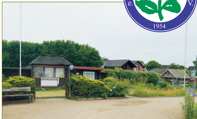
Am Samstag wird in der Kleingartenanlage in Ratekau der „Tag des Gartens“ gefeiert.

Das ist jedes Jahr für die Kleingärtner ein Grund zum Feiern – so auch in Ratekau. In diesem Jahr findet dieser „Tag des Gartens“ in Ratekau am Samstag, dem 13. Juni, statt. Ab 15 Uhr gibt es Kaffee/Tee und selbstgebackenen Kuchen im Eingangsbereich des Kleingartengeländes am Gartenweg in Ratekau. Dazu sind nicht nur die Mitglieder des Kleingärtnervereins Ratekau eingeladen, sondern auch weitere Besucher, die sich für Kleingarten interessieren. Bei einem anschließenden