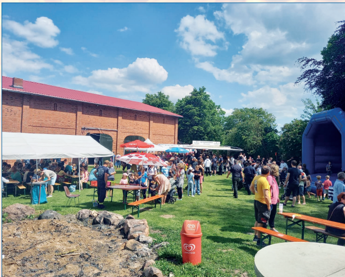
Das Kinderfest der Feuerwehr findet auf dem Hof Ulrich statt.

Offendorf. In ihrem Jubiläumsjahr lädt die Freiwillige Feuerwehr Offendorf besonders gerne zu ihrem beliebten Kinderfest ein. Es findet am Samstag, dem 13. Juni, auf dem Hof Ulrich in Offendorf statt, und beginnt um 14 Uhr. Auch diesmal steht das Motto „Retten, Bergen, Löschen und Spielen“ im Mittelpunkt.