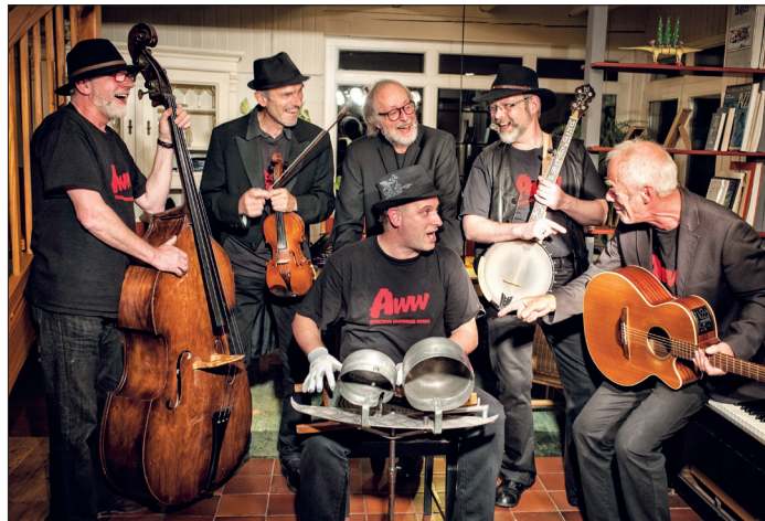
„Appeltown Washboard Worms“ liefern Skiffle-Rock vom Feinsten.

in Ratekau, Rosenstraße 1, und im TUI Reisebüro Ratekau, Bäderstraße 34. Restkarten gibt es auch noch am 26. Juni an der Abendkasse, die gemeinsam mit dem Getränkeservice ab 18.30 Uhr öffnet.