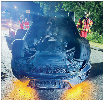
Der Audi blieb nach der Kollision mit dem Baum auf dem Dach liegen.

Nach bisherigem Ermittlungsstand befuhr der oder die Fahrer/in die Straße Bövelstredder und bog nach rechts in den Schürsdorfer Weg ein. Während der Rechtskurve kam der Pkw mutmaßlich aufgrund von überhöhter Geschwindigkeit und nasen Straßenverhältnissen nach links von der Straße ab und touchierte einen Bordstein. Anschließend kam das Fahrzeug nach