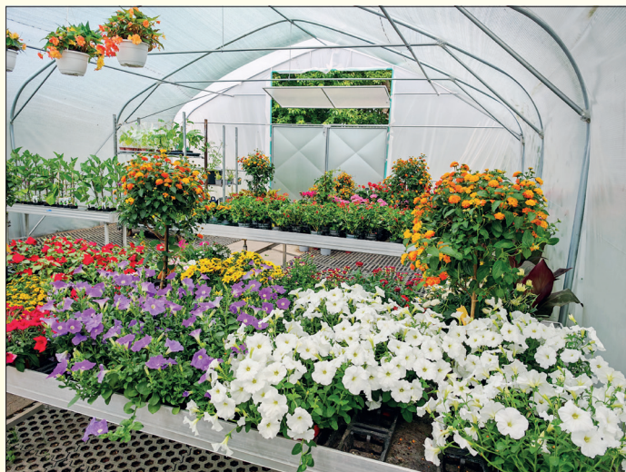
Im Folientunnel direkt neben dem Landmarkt sind aktuell noch frische Sommerblumen erhältlich.