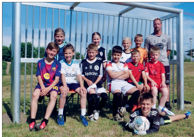
Resultat: „Test bestanden“, so das Urteil der Nachwuchskicker.

Am vergangenen Mittwoch nutzte die E2 des TSV Pansdorf die Gelegenheit, die neuen Tore direkt auszuprobieren. Die jungen Fußballer