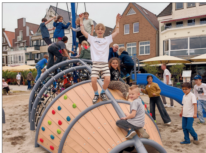
Die Kinder der Stadtschule Travemünde hatten sichtlich Spaß, das neue Spielgerät zu testen.