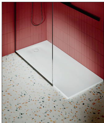
Auch Sonderwünsche im Bad unterliegen der Grunderwerbsteuer.

Basis des gezahlten Kaufpreises jeweils Bescheide zur Grunderwerbsteuer für die Eheleute. Auf Nachfrage des Finanzamts übermittelten diese dem zuständigen Finanzamt eine Abrechnung der Sonderwünsche. Daraufhin stellte das Finanzamt weitere Steuerbescheide aus und erhob Grunderwerbsteuer auf den Rechnungsbetrag der Sonderwünsche. Dagegen richtete sich die Klage der Wohnungskäufer.