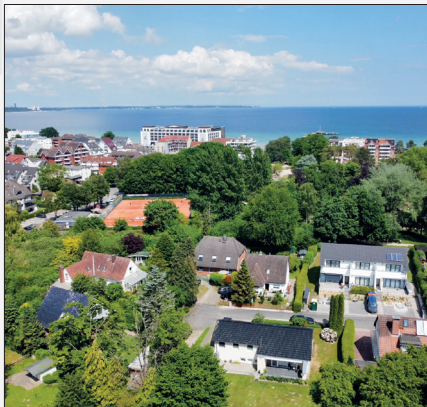
In unmittelbarer Nähe zum Kurpark und nicht weit vom Strand entfernt liegt das Einfamilienhaus, das Loose Immobilien in Scharbeutz aktuell zum Kauf anbietet.

Scharbeutz. Das hier von Loose Immobilien angebotene Einfamilienhaus befindet sich in Sackgassen-/Spielstraßenlage in unmittelbarer Nähe zum Kurpark in Scharbeutz und wurde im Jahr 1960 in massiver Bauweise errichtet. Im Jahr 2007 erfolgte eine umfassende Sanierung des Gebäudes (neue Fenster, Fassade, Dämmung und Heizung, Dach, etc.). Die Immobilie verfügt über zirka 127 m 2 Wohn-Nutzfläche mit vier Zimmern. Die Aufteilung umfasst einen Wohn- und Essbereich mit offener Einbauküche, ein Schlafzimmer sowie zwei weitere Zimmer, die als Gäste- oder Arbeitszimmer genutzt werden können. Das Raumangebot wird durch ein Vollbad, Gäste-WC und Abstellraum ergänzt. Ein besonderes Highlight ist die Terrasse mit elektrischer Markise, die in den pflegeleicht angelegten Garten übergeht. Das Eigenlandgrundstück ist zirka 911 m 2 groß, inklusive Carport und Geräteschuppen. Zur Ausstattung gehören eine hochwertige Einbauküche mit allen gängigen Elektrogeräten, ein modernes Vollbad, hell gefliest mit Fenster + Gäste-WC, Teppichböden in den Schlafräumen, Parkettboden im Wohn-Esszimmer, ein gepflegter Garten mit viel Platz und Geräteschuppen, eine sonnige Terrasse mit elektrischer Markise, ein Abstellraum